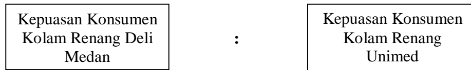
Gambar II.1 Kerangka Konseptual