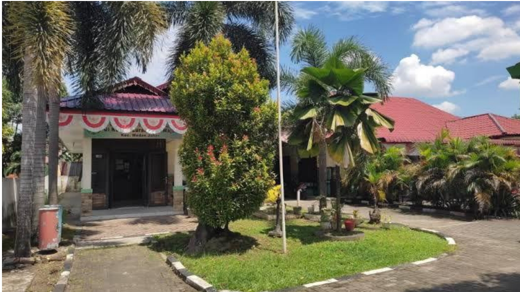
Gambar 4.1.3. 1 Lokasi Penelitian Balai KB