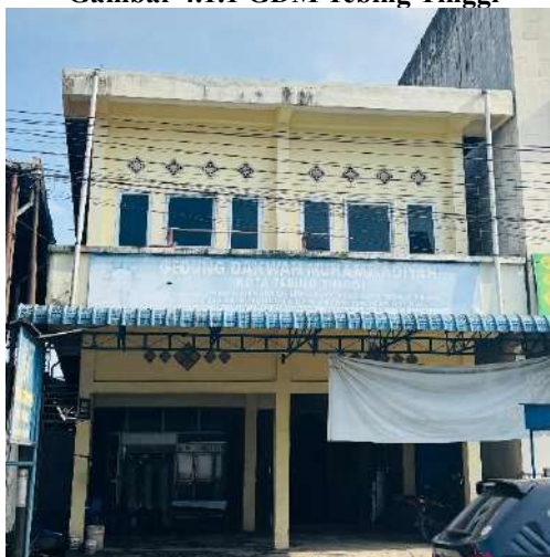
Gambar 4.1.1 GDM Tebing Tinggi

Muhammadiyah di Kota Tebing Tinggi juga didukung oleh organisasi otonomnya yaitu, Aisyiah, Pemuda Muhammadiyah, dan Ikatan Pelajar Muhammadiyah (IPM). Muhammadiyah di Kota Tebing Tinggi juga memiliki Gedung Dakwah yang berfungsi sebagai pusat kegiatan organisasi otonomnya, seperti rapat dan pelatihan kader. Gedung Dakwah Muhammadiyah tersebut beralamat di Jl. Sisingamangaraja No. 47, Kota Tebing Tinggi.