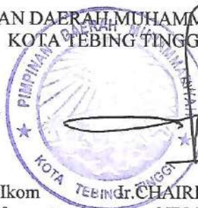
CHAIRIL SIHOMBING , S.Pd NBM : 1225217