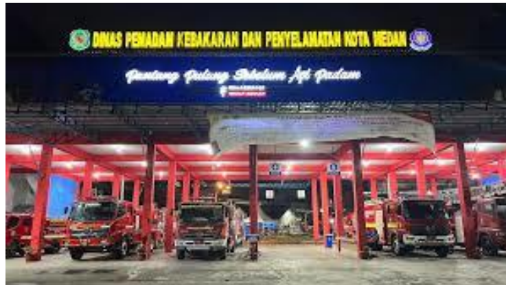
Gambar 4.1 Lokasi Penelitian