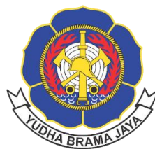
Gambar 4.2 Logo Dinas Pemadam Kebakaran