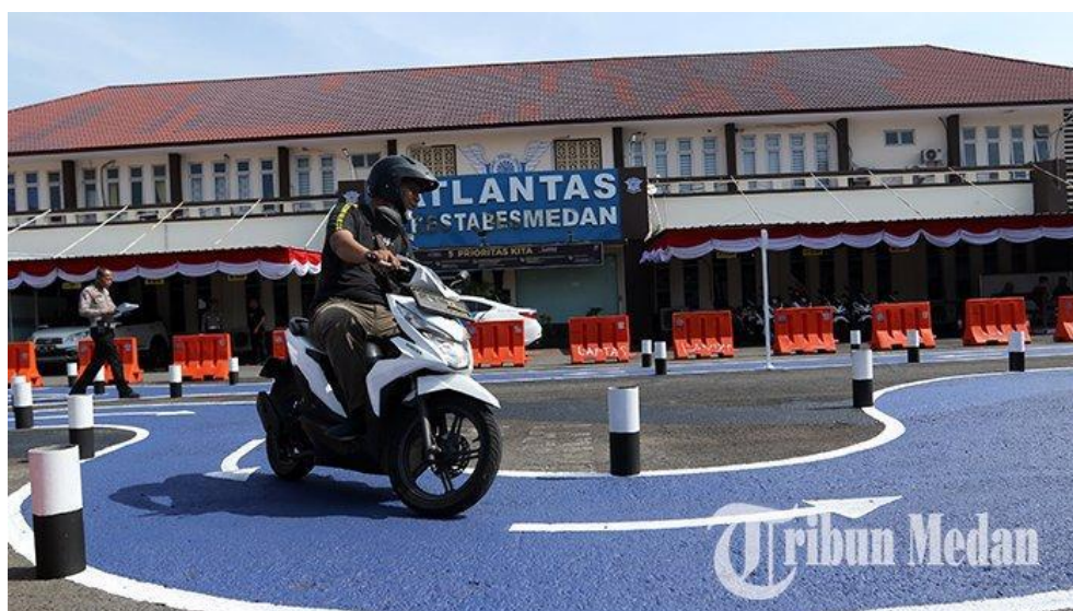
Gambar 3.2 Lokasi Penelitian

Penelitian ini dilaksanakan pada bulan November 2025 sampai Februari 2026, lokasi penelitian berada di Satlantas Polrestabes Medan Jln. HM. Said No. 1, Gaharu, Medan Timur, Kota Medan, Sumatera Utara, 20235.