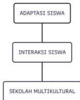
Gambar 3.1 Kerangka Konsep