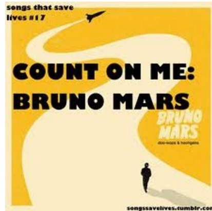
Gambar 4.2 Cover Album Count On Me

Lagu Count On Me yang dipopulerkan oleh Bruno Mars dalam album Doo-Wops & Hooligans menyampaikan pesan dukungan emosional dalam bentuk yang lebih egaliter dan stabil.