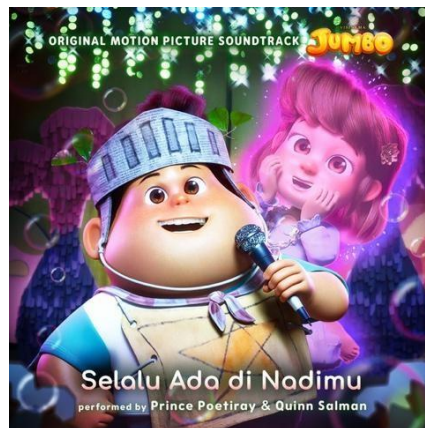
Gambar 4.1 Cover album selalu ada di Nadimu

Lagu Selalu Ada Di Nadimu karya Jumbo membangun pesan dukungan emosional melalui narasi yang bersifat protektif dan empatik.