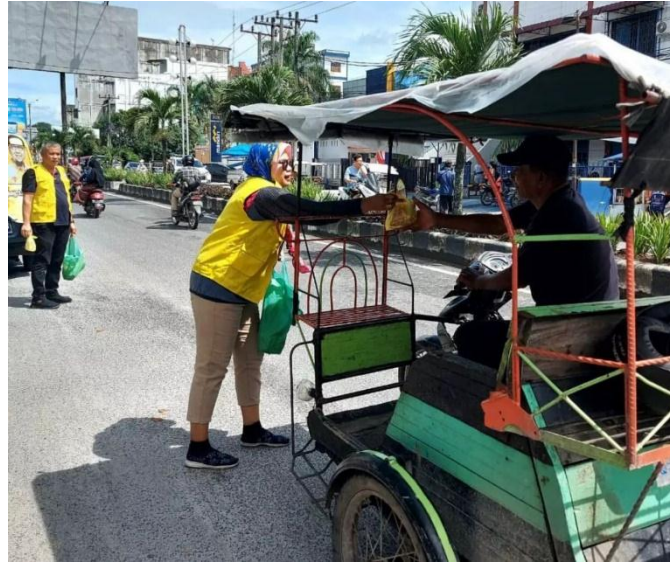
Gambar 4.2.1 Partai Golkar melakukan kegiatan jumat berbagi