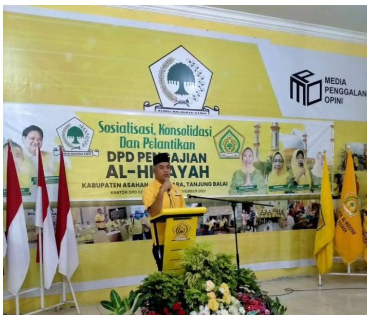
Gambar 4.2.2 Penyerahan penghargaan oleh ketua DPD partai Golkar Asahan Kepada Pengajian Al-Hidayah

Ketua DPD partai Golkar Asahan turun langsung ke jalanan untuk menjalankan kegiatan jum'at berbagi yang di adakan setiap minggunya oleh Partai Golkar Asahan, kegiatan jum'at berbagi yang dilakukan oleh Partai Golkar Asahan mendapatkan antusias yang tinggi dari Masyarakat menengah kebawah, dengan adanya kegiatan tersebut Masyarakat merasa di ayomi, Ketua DPD Partai Golkar Asahan juga mengajak seluruh kader Partai Golkar Asahan untuk turun ke jalanan agar dapat menjalankan kegiatan jum'at berbagi tersebut lebih luas areanya, lokasi kegiatan Partai Golkar Asahan untuk melakukan jum'at berbagi biasanya di area masjid-mesjid terdekat.