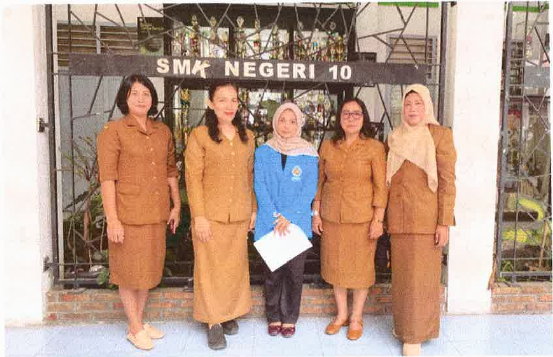
Gambar 1. Photo Peneliti bersama para narasumber