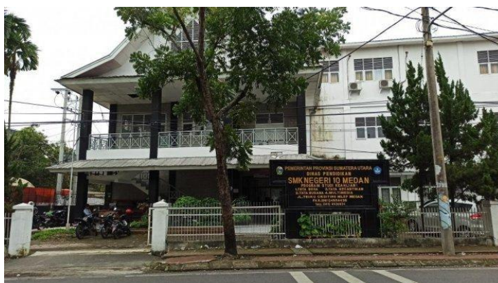
Gambar 3.2. SMK Negeri 10 Medan