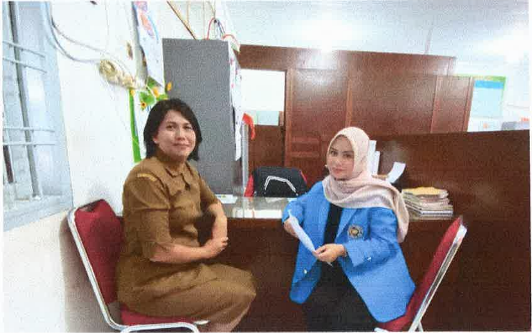
Sumber: Dokumentasi Peneliti 2026