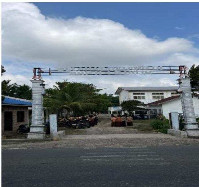
Gambar 4.2 SMP Negeri 4 Bilah Hilir

mengamati secara langsung interaksi komunikasi antara guru dan siswa dalam konteks pembelajaran.