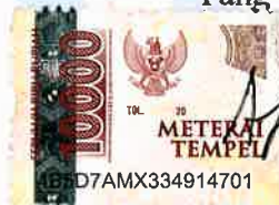
Alfi Salsabilah Nasution