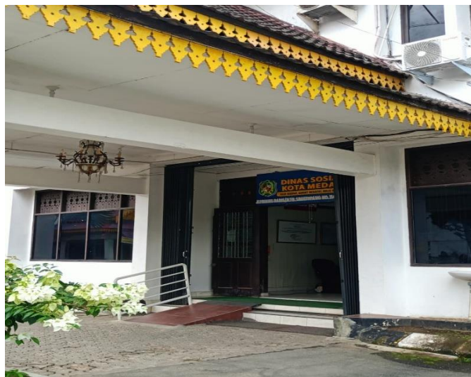
Gambar 3.8 Kantor Dinas Sosial Kota Medan

Penelitian ini dilaksanakan selama kurun waktu empat bulan. Lokasi penelitian difokuskan pada Dinas Sosial Kota Medan sebagai instansi yang bertanggung jawab dalam pelaksanaan kebijakan, serta pada Rumah Perlindungan Sosial dan penyandang disabilitas dan lanjut usia di Kota Medan, sebagai lokasi implementasi Peraturan Daerah Kota Medan Nomor 2 Tahun 2024 tentang Perlindungan Penyandang Disabilitas dan Lanjut Usia.