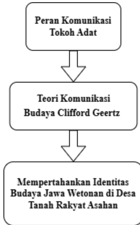
Gambar 3.1 Kerangka Konsep