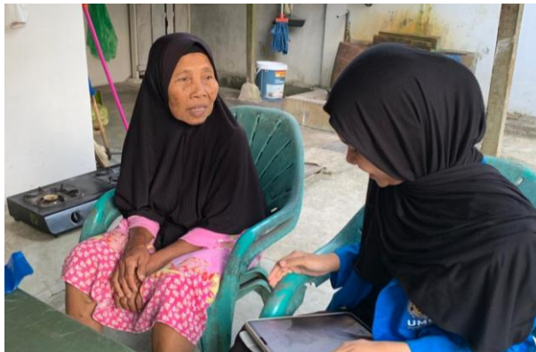
Dokumentasi Penelitian: Peneliti mewawancarai informan 3