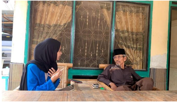
Dokumentasi Penelitian: Peneliti mewawancarai informan 1