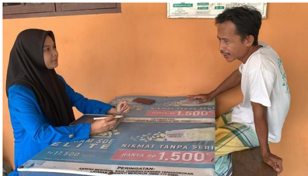
Dokumentasi Penelitian: Peneliti mewawancarai informan 2