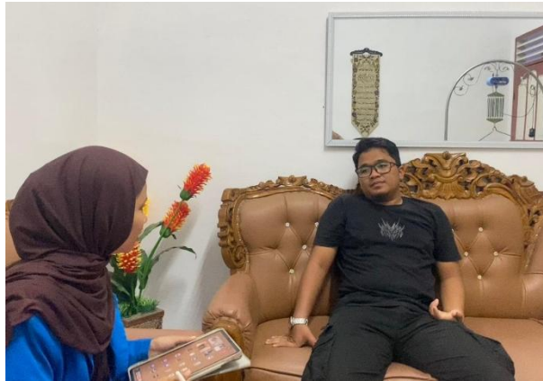
Dokumentasi Penelitian: Peneliti mewawancarai informan 4