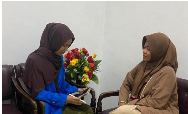
Dokumentasi Penelitian: Peneliti mewawancarai informan 5