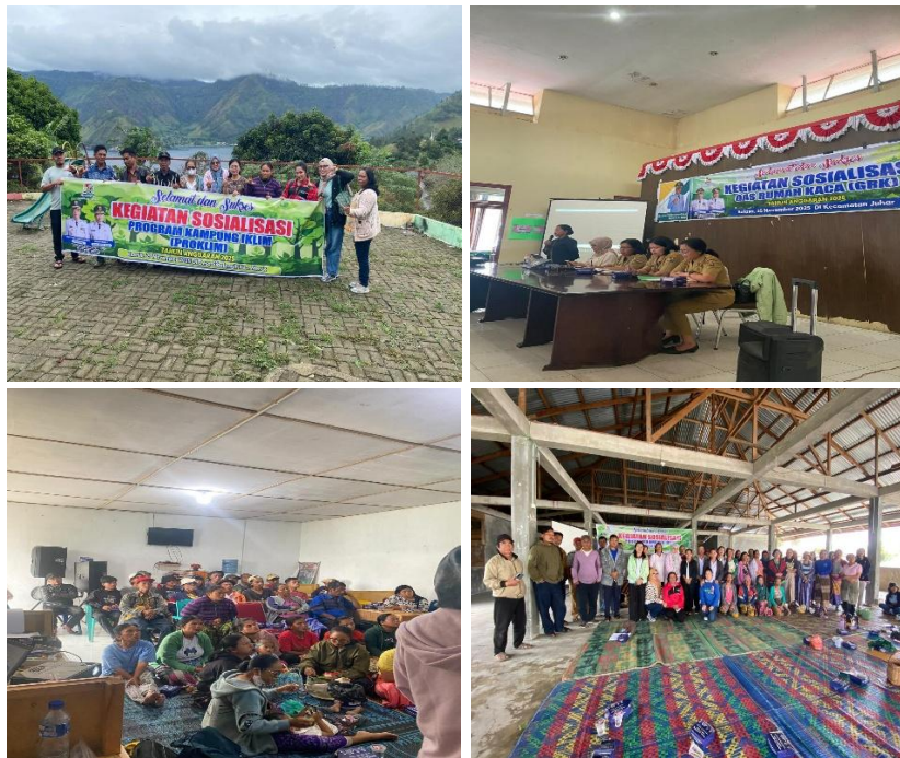
Gambar 4.1 Kegiatan Sosialisasi Program Kampung Iklim

Rangkaian pelaksanaan Program Kampung Iklim dilakukan melalui tahapan perencanaan, pelaksanaan, pemantauan, dan evaluasi kegiatan. Pemerintah daerah melalui Dinas Lingkungan Hidup berperan dalam menyusun rencana kegiatan dan memberikan arahan kepada pelaksana program di lapangan. Selanjutnya, pelaksana program bekerja sama dengan masyarakat dalam menjalankan kegiatan sesuai dengan jadwal dan tujuan yang telah ditetapkan. Proses pemantauan dilakukan untuk memastikan kegiatan berjalan sesuai rencana, sedangkan evaluasi digunakan sebagai dasar perbaikan pelaksanaan program ke depannya.