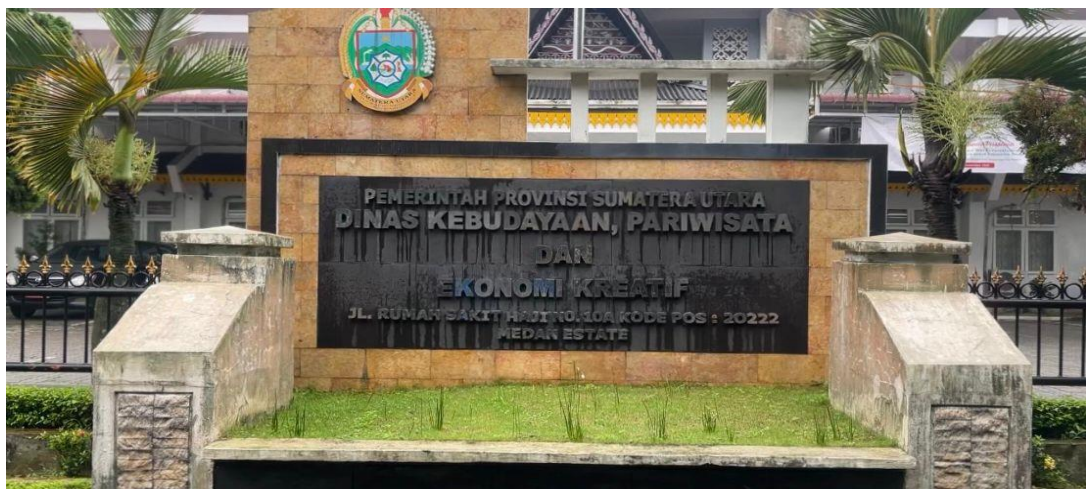
Gambar 3.3. Lokasi Penelitian 2026