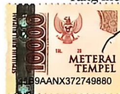
Nurul Wulan Azhari