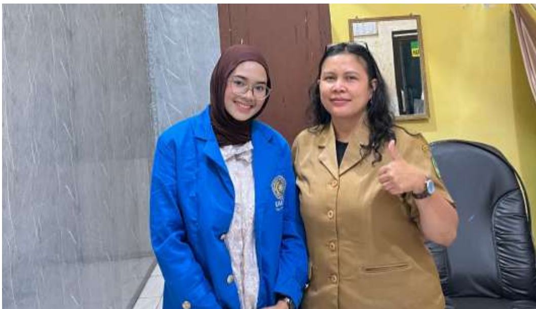
Gambar 5. Bersama Ibu Sekretaris Lurah Pulo Brayan Darat I