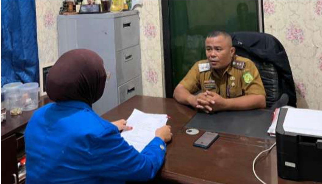
Gambar 4. Bersama Bapak Lurah Pulo Brayan Darat I