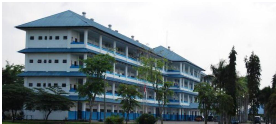
Gambar 4.1 SMA Harapan 3 Medan