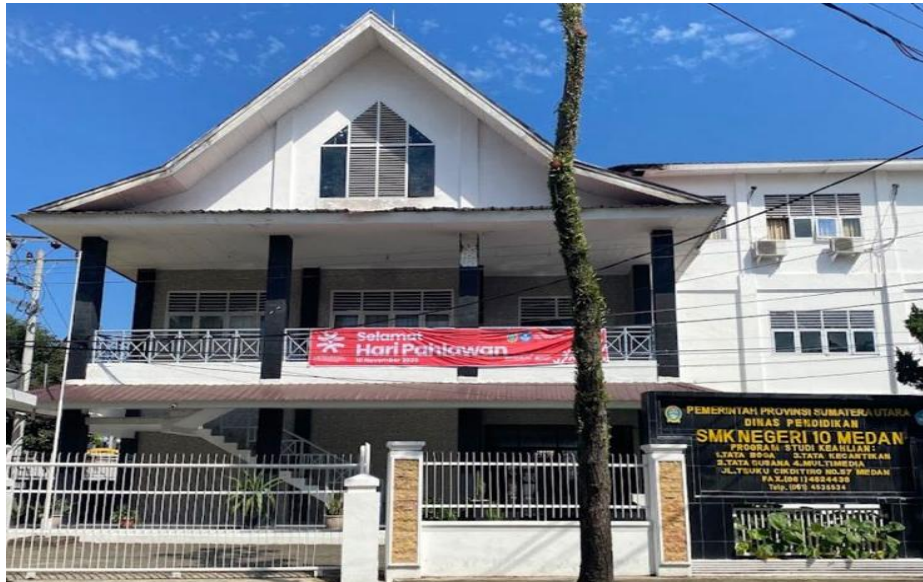
Gambar 3.2 SMK Negeri 10 Medan