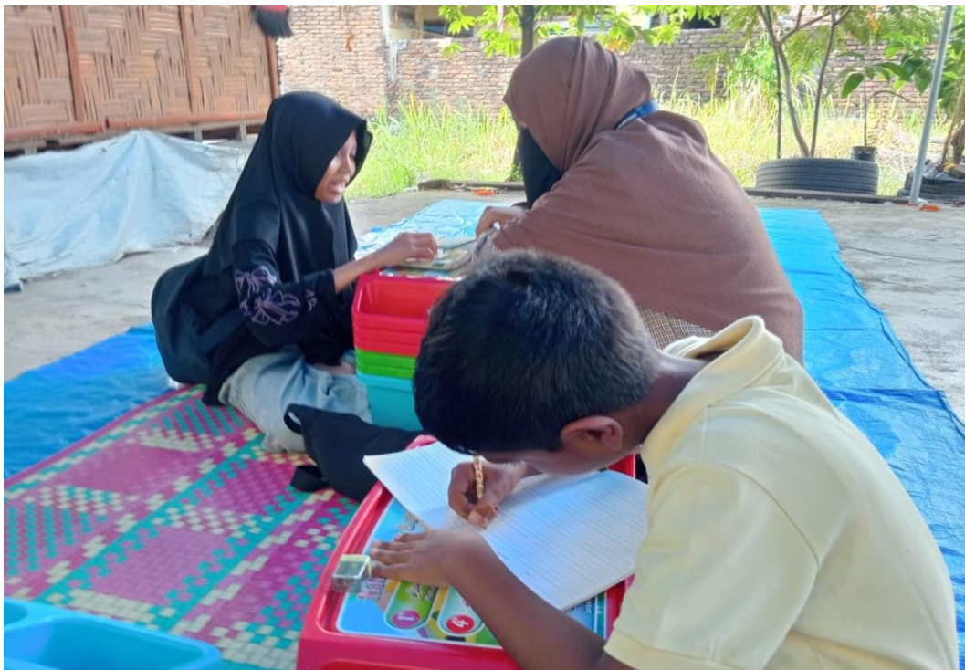
Gambar 5 & 6 Penguatan kemampuan membaca anak-anak dengan menulis Bahasa arab