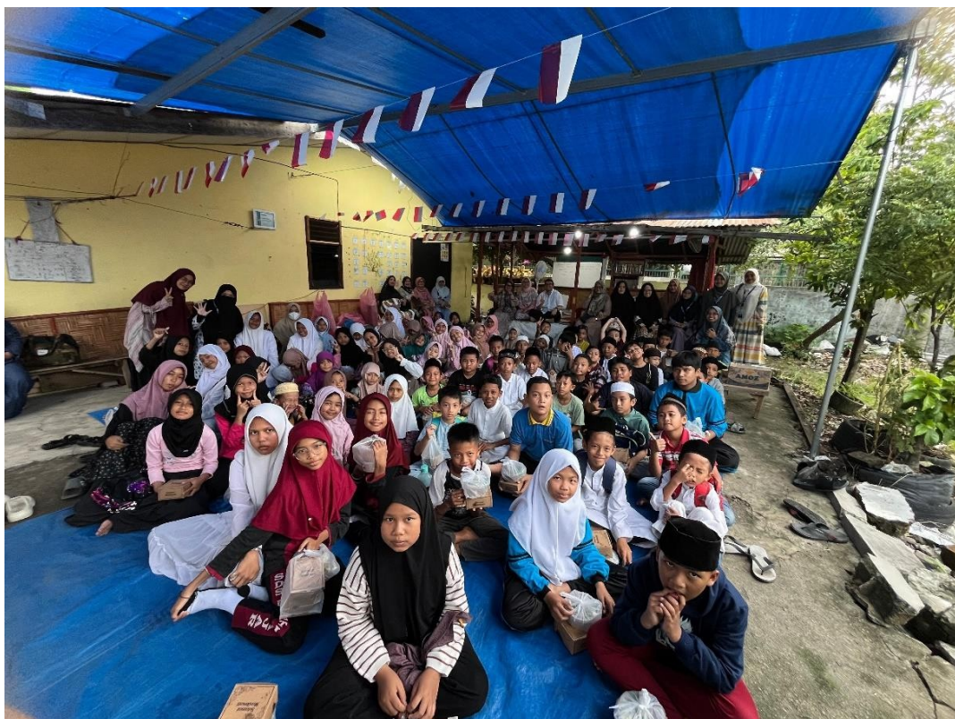
Gambar 12 Dokumentasi seluruh murid di Ruma Tahfizh Tadzkia