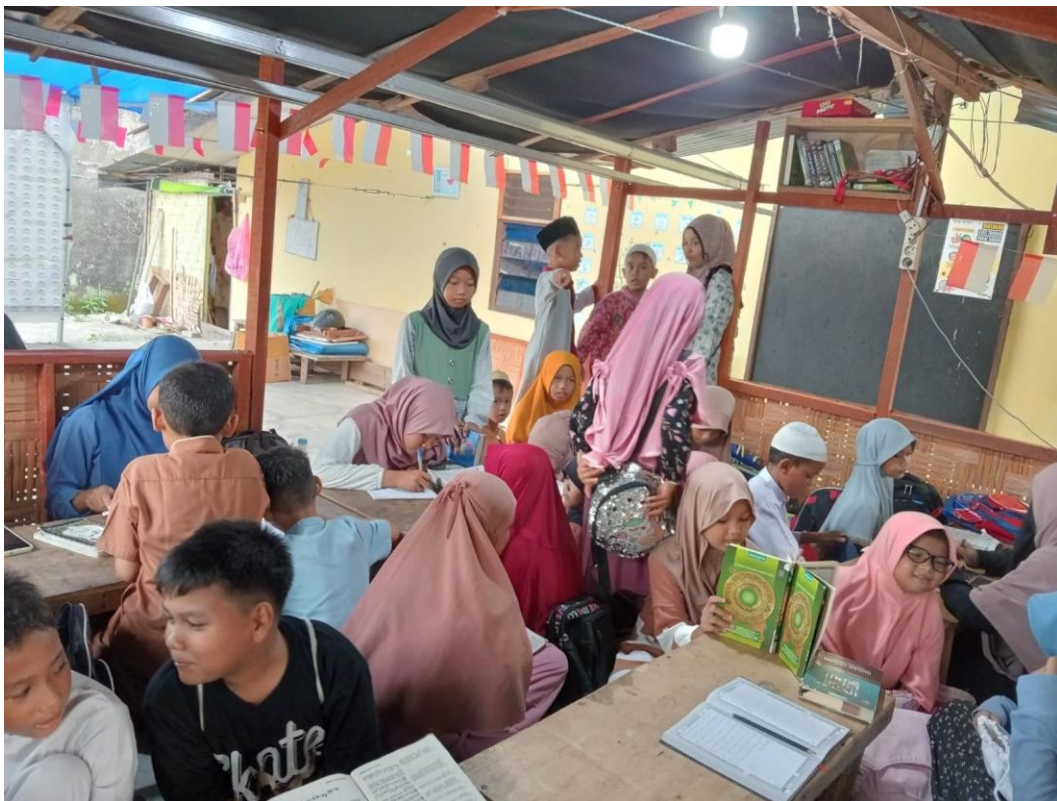
Gambar 7 & 8 Suasana pembelajaran di Rumah Tahfiz Tadzkia