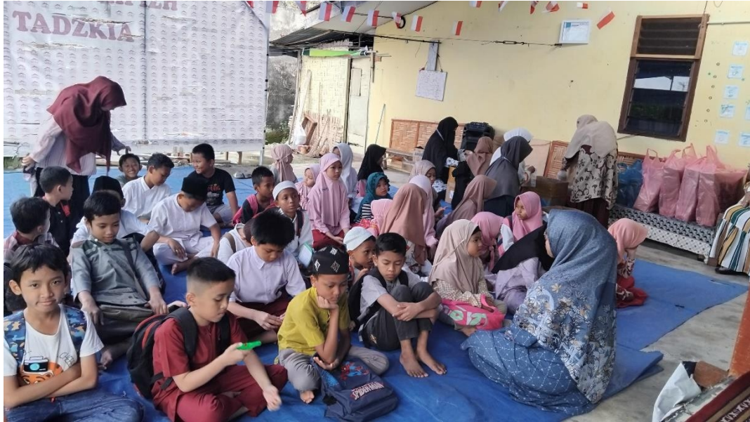
Gambar 11 dokumentasi do'a setelah belajar