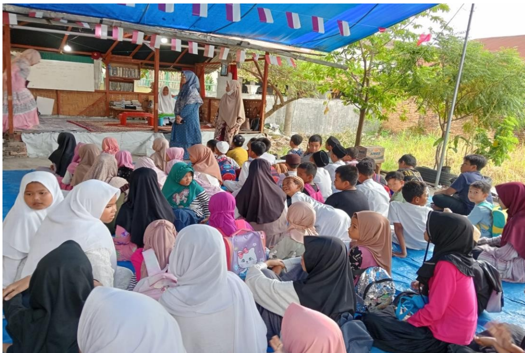
Gambar 1 & 2 Proses pembelajaran metode Qiroati diawali do'a bersama untuk memulai pembelajaran