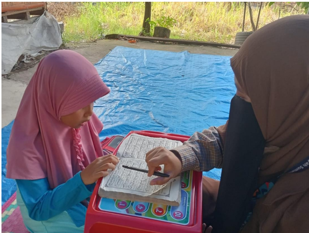
Gambar 3 & 4 Penerapan metode Qiroati untuk mengoptimalkan kemampuan bacaan Anak-anak usia sekolah dasar