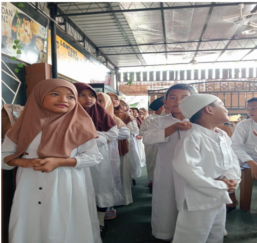
Gambar 9 & 10 Dokumentasi wisuda anak-anak yang lulus ujian