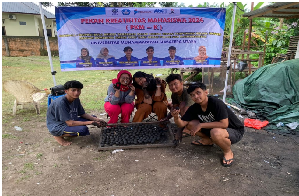
Gambar 3. Produksi Briket (BRIQBALL)