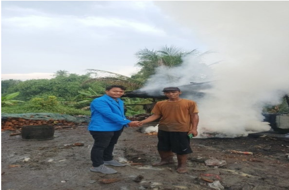
Gambar 2. Wawancara Bersama Pelaku Usaha Arang Tempurung Kelapa