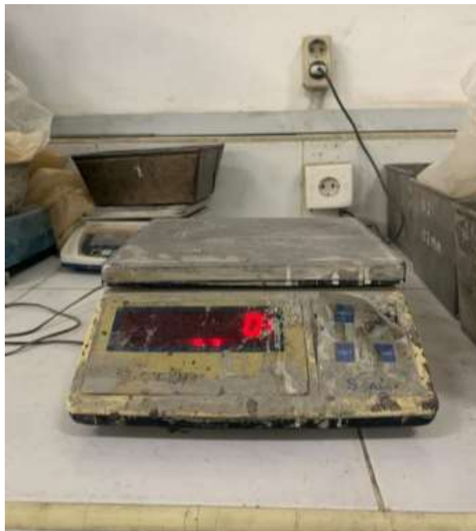
Gambar Lampiran- 10: Timbangan Digital