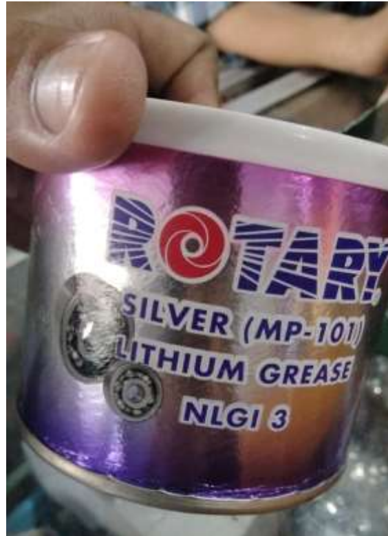
Gambar Lampiran- 19: Pelumas