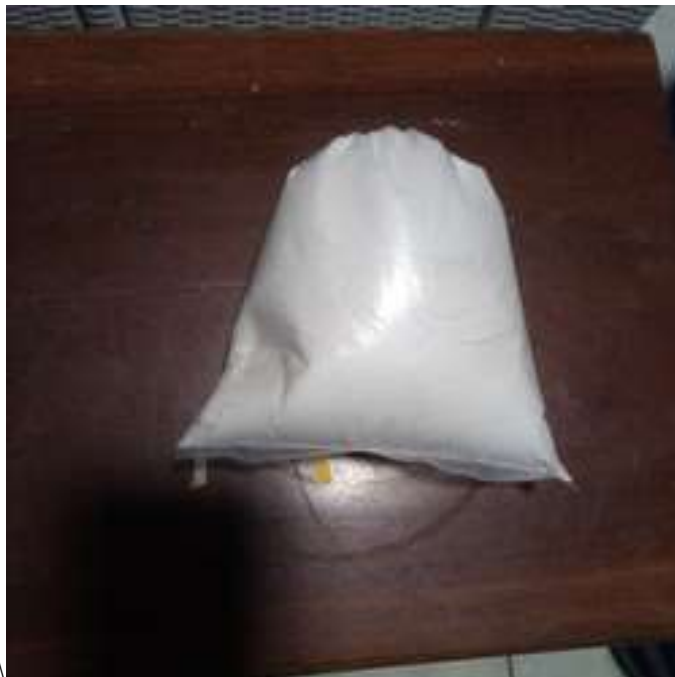
Gambar Lampiran- 6: Gypsun