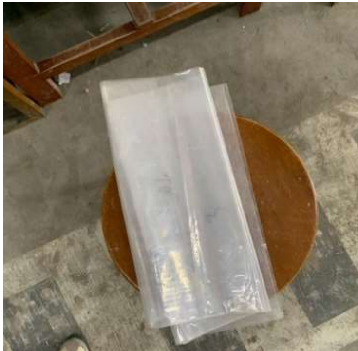
Gambar Lampiran- 12: Plastik