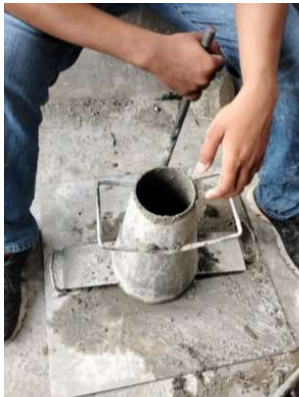
Gambar Lampiran- 28: slump test