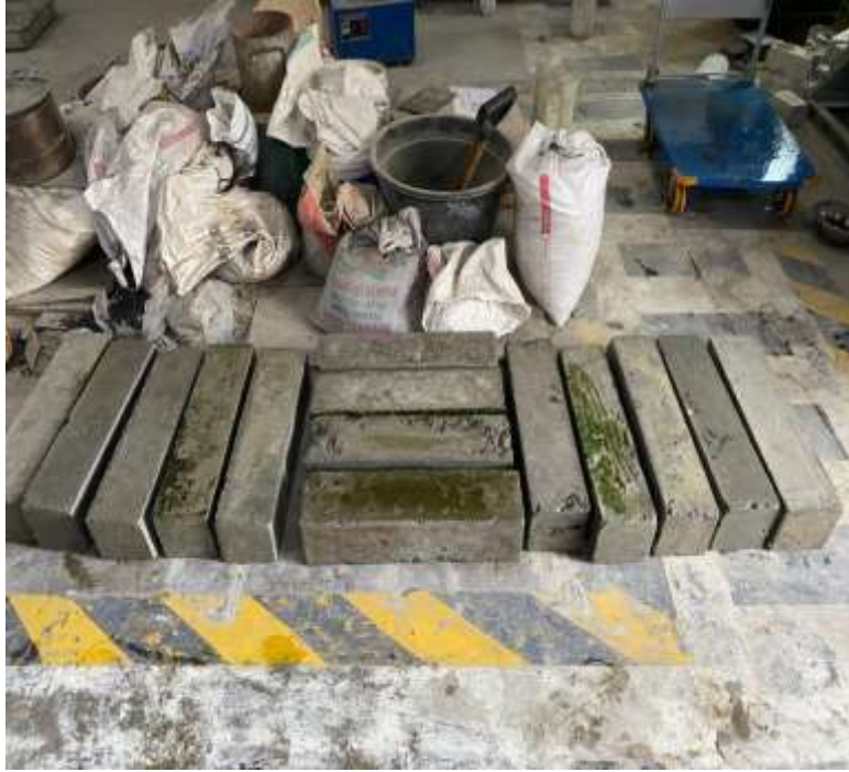
Gambar Lampiran- 31: Beton setelah perendaman