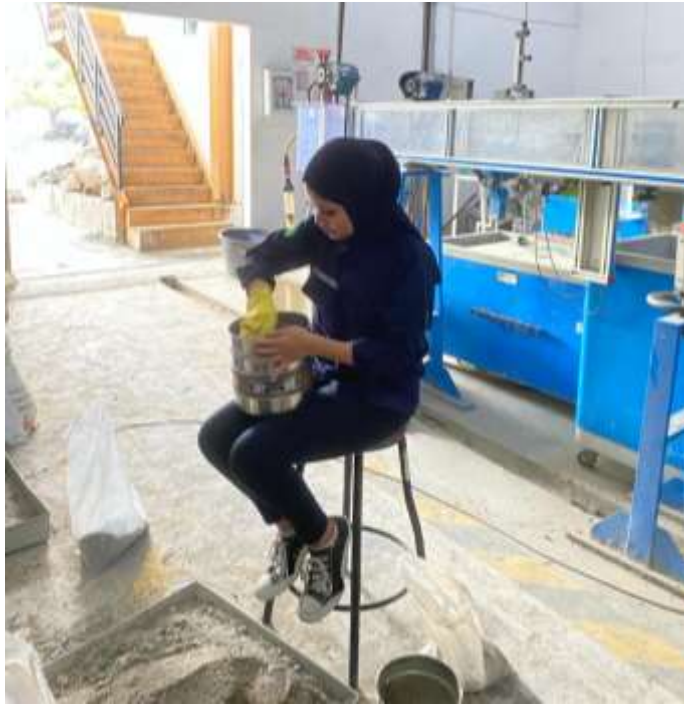
Gambar Lampiran- 25: Analisa Saringan