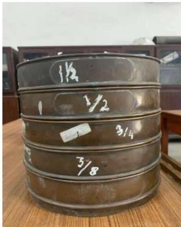
Gambar Lampiran- 8: Saringan agregat kasar