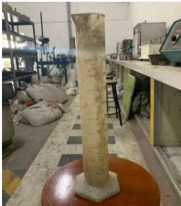
Gambar Lampiran- 18: Tabung Ukur