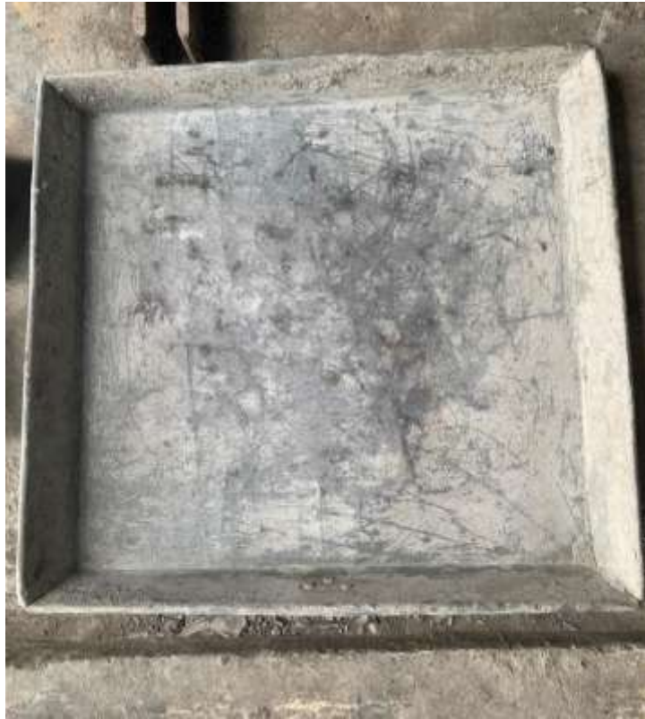
Gambar Lampiran- 11: Pan