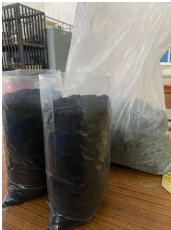
Gambar Lampiran- 4: Abu Ampas Tebu