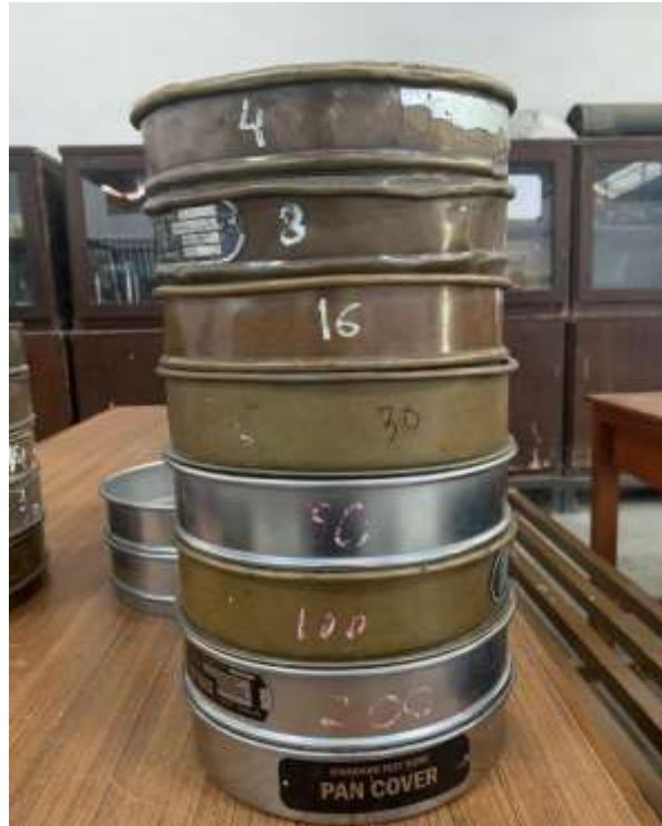
Gambar Lampiran- 7: Saringan agregat halus