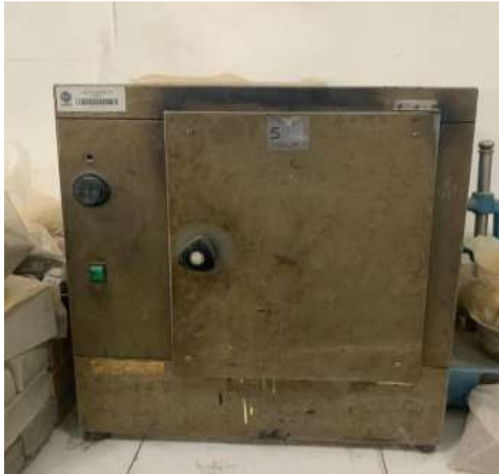
Gambar Lampiran- 9: Oven