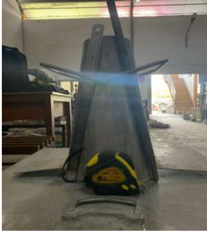
Gambar Lampiran- 13: Satu set alat slump test