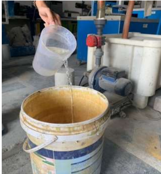
Gambar Lampiran- 5: Air