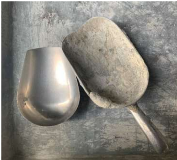
Gambar Lampiran- 16: Skop tangan