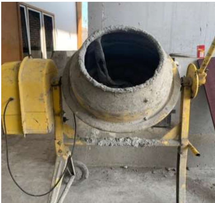
Gambar Lampiran- 22: Mesin pengaduk semen (Mixer)