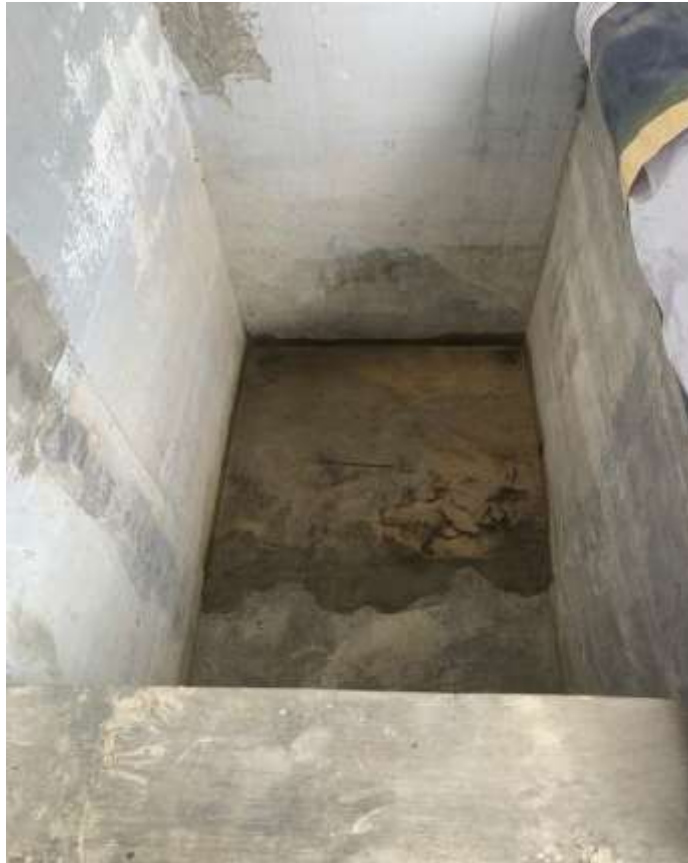
Gambar Lampiran- 23: Bak Perendaman