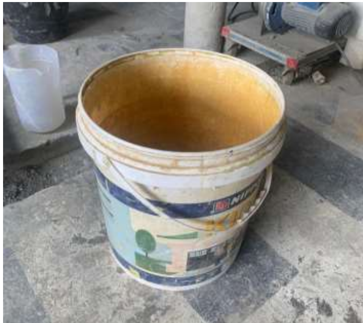
Gambar Lampiran- 14: Ember