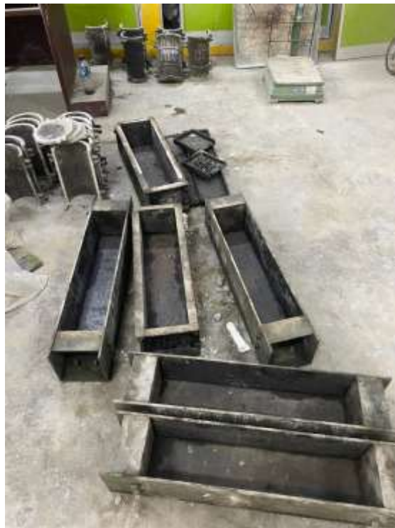
Gambar Lampiran- 20: Cetakan Balok