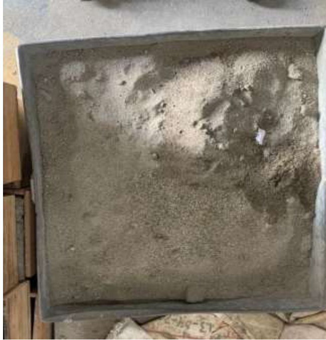
Gambar Lampiran- 3: Agregat Halus