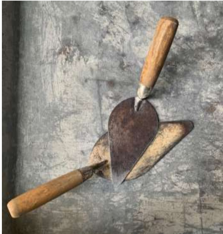
Gambar Lampiran- 15: Sendok semen