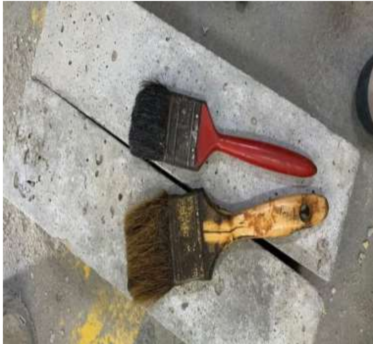
Gambar Lampiran- 17: Kuas