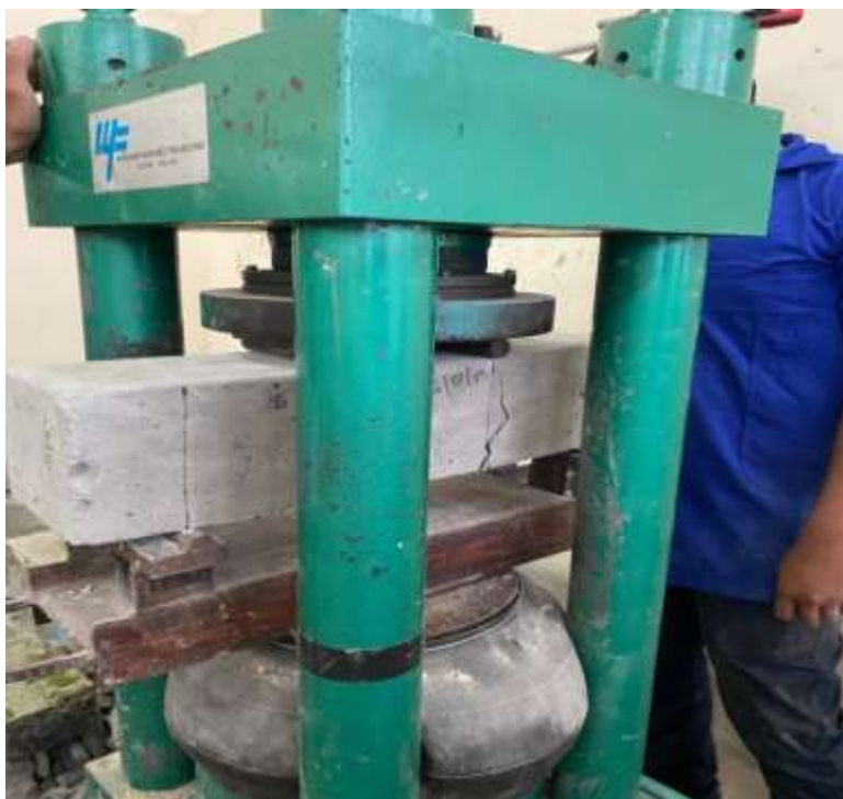
Gambar Lampiran- 24: Compression machine test