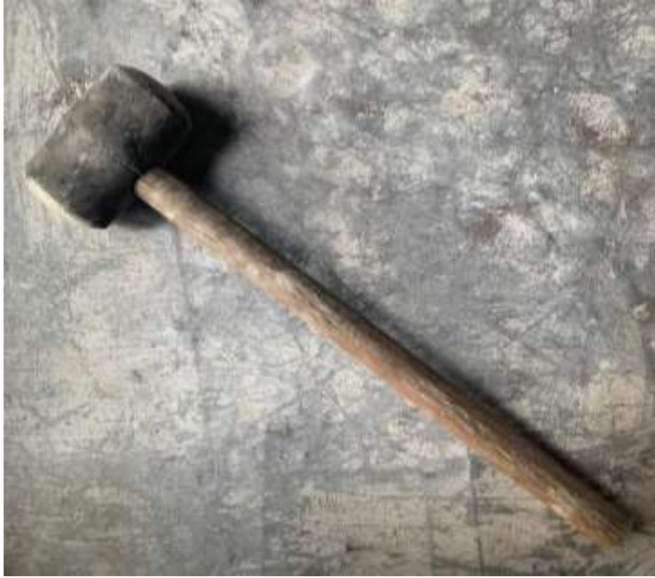
Gambar Lampiran- 21: Palu Karet