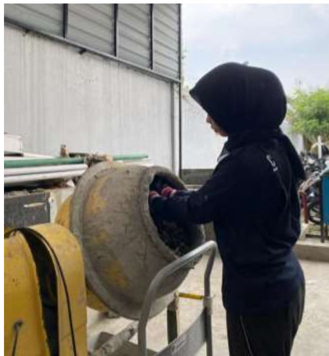
Gambar Lampiran- 26: Mixer Bahan