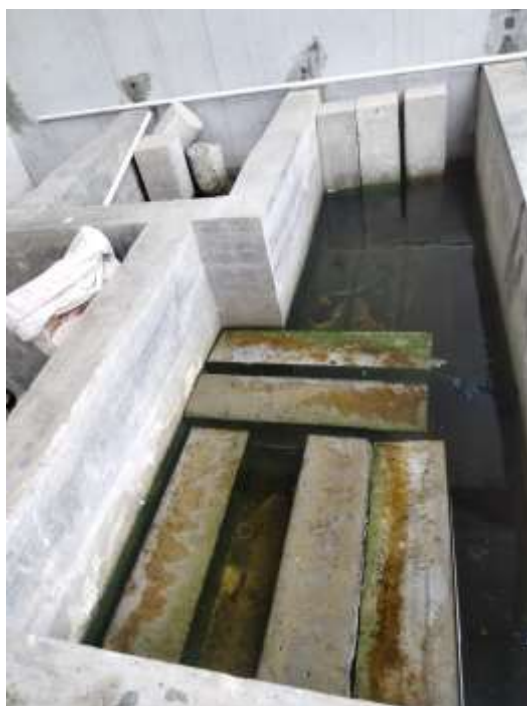
Gambar Lampiran- 30: Perendaman