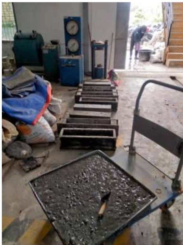
Gambar Lampiran- 29: Mencetak