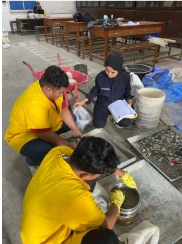
Gambar Lampiran- 27: Analisa Saringan