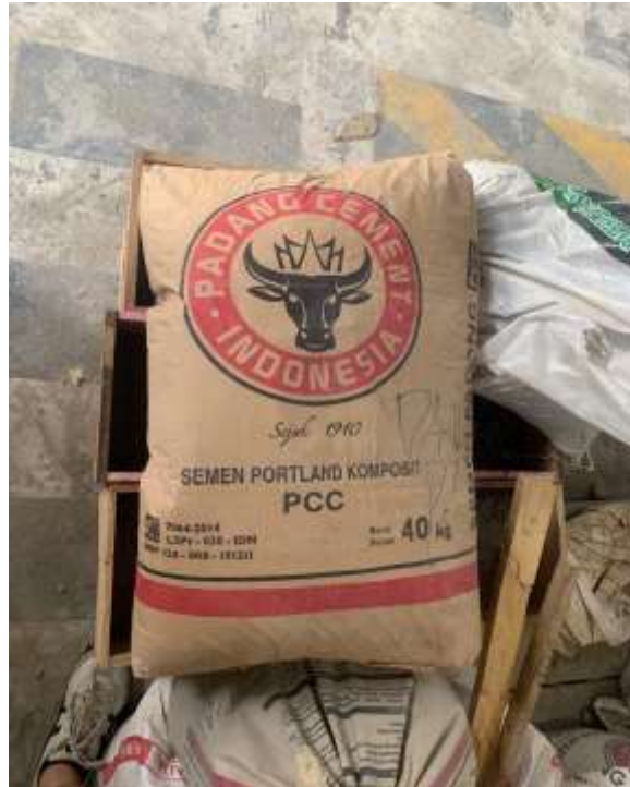
Gambar Lampiran- 1: Semen