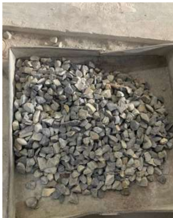
Gambar Lampiran- 2: Agregat Kasar