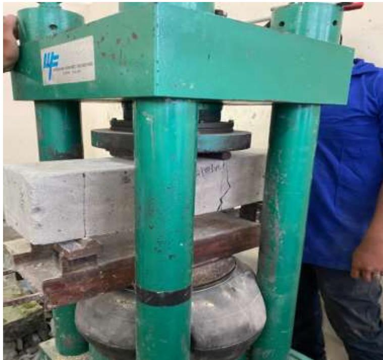
Gambar Lampiran- 32: Pengujian