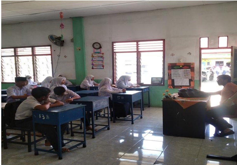
Proses Pembelajaran Pendidikan Agama Islam (PAI)