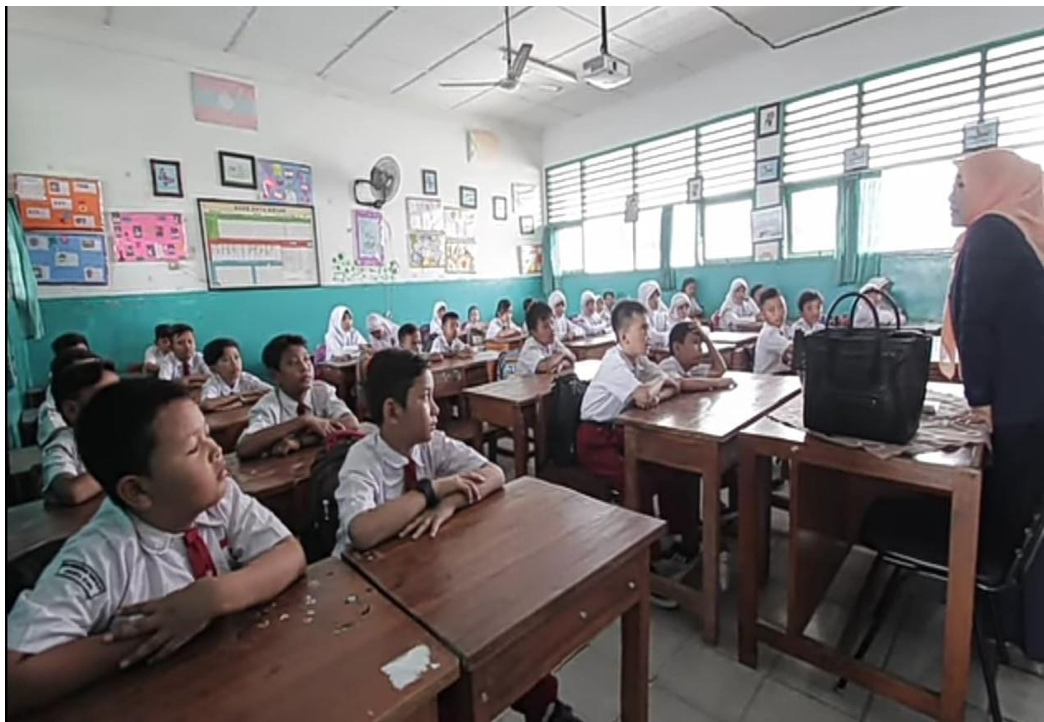
Gambar 2 : Observasi (Peninjauan) di Salah Satu Kelas