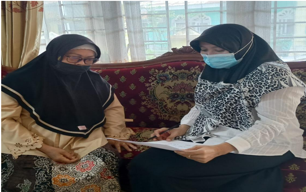
Gambar 1 Proses Wawancara Dengan Kepala Sekolah di Lapangan