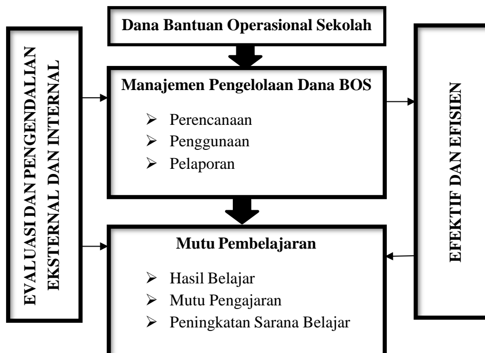
Gambar 2.1 Kerangka Berfikir Penelitian

Berdasarkan fokus penelitian, hasil riset sebelumnya juga teori yang dijadikan acuan maka kerangka berfikir penelitian dapat digambarkan sebagai berikut :