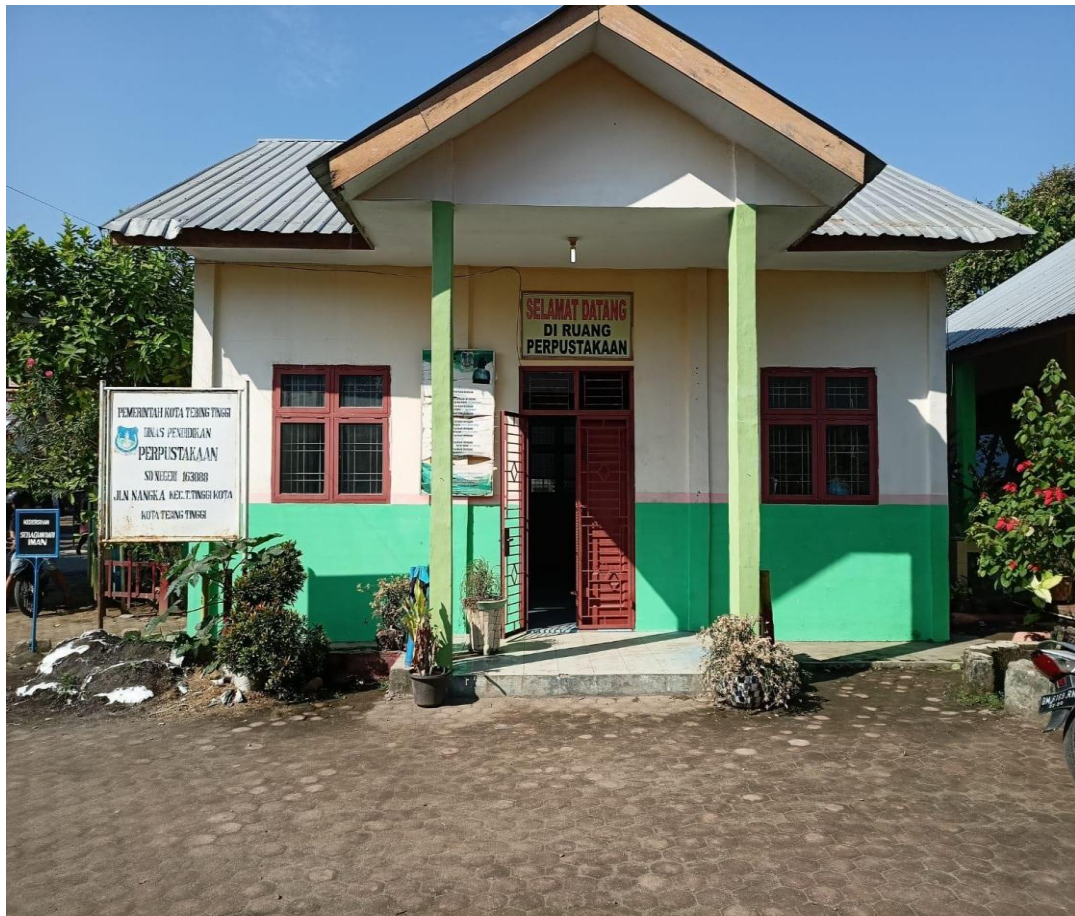
Gambar 5, Perpustakaan