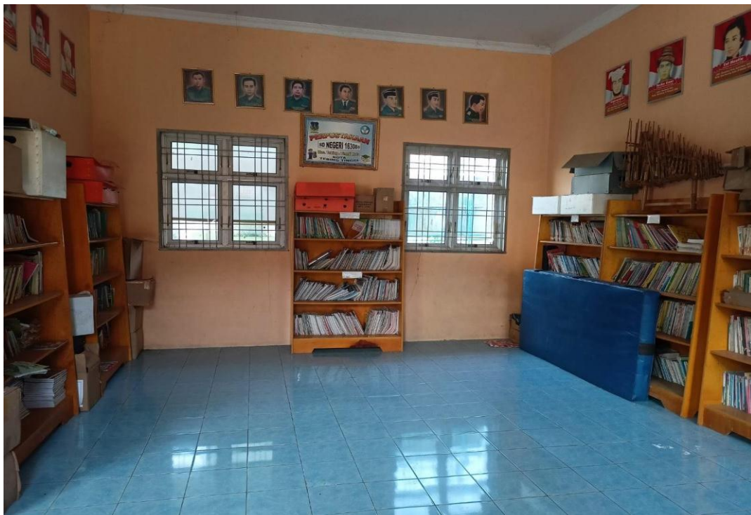
Gambar 4; Perpustakaan