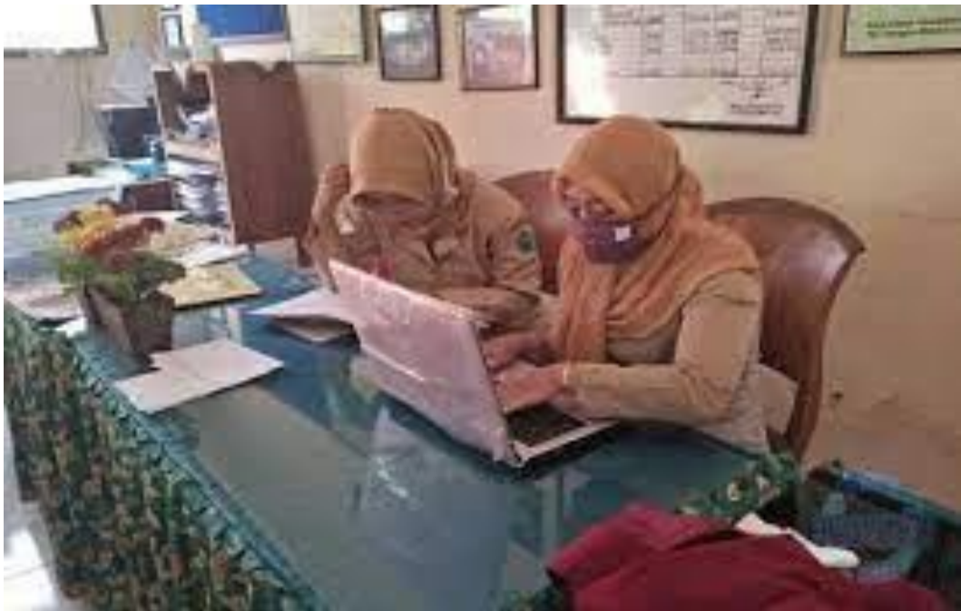
Gambar 3 Proses Wawancara Dengan Guru di Lapangan