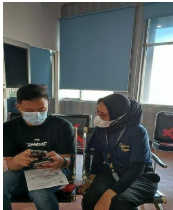
Membantu Pelaporan SPT Tahunan