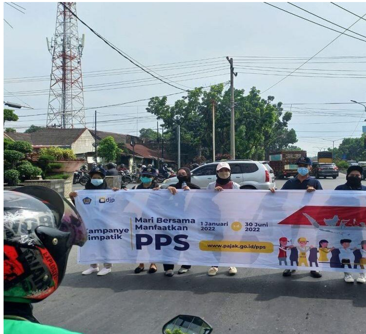
Kampanye Simpatik Relawan Pajak