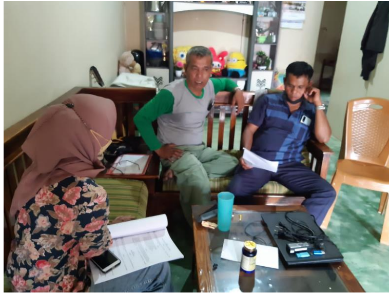
Foto wawancara bersama Ketua BUMDes Mantap