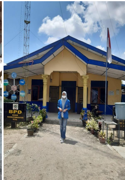
Foto Kantor Kepala Desa Suka Ramai