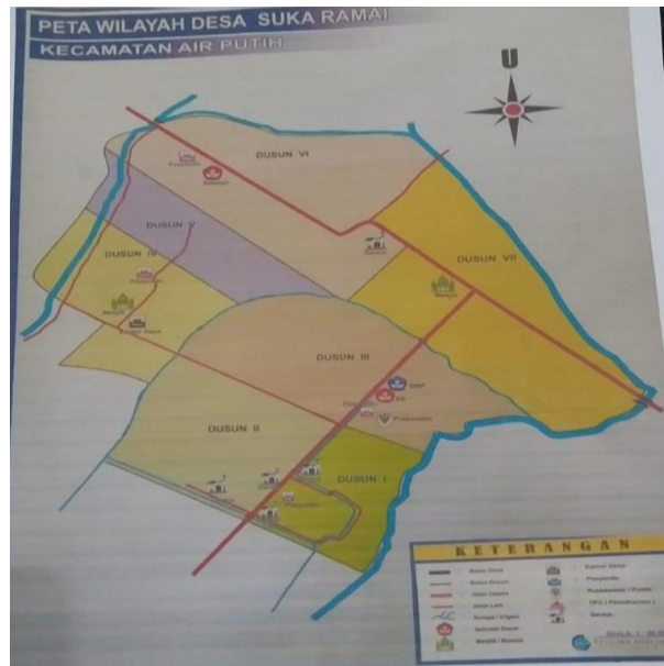
Gambar 2. Peta Wilayah Desa Suka Ramai