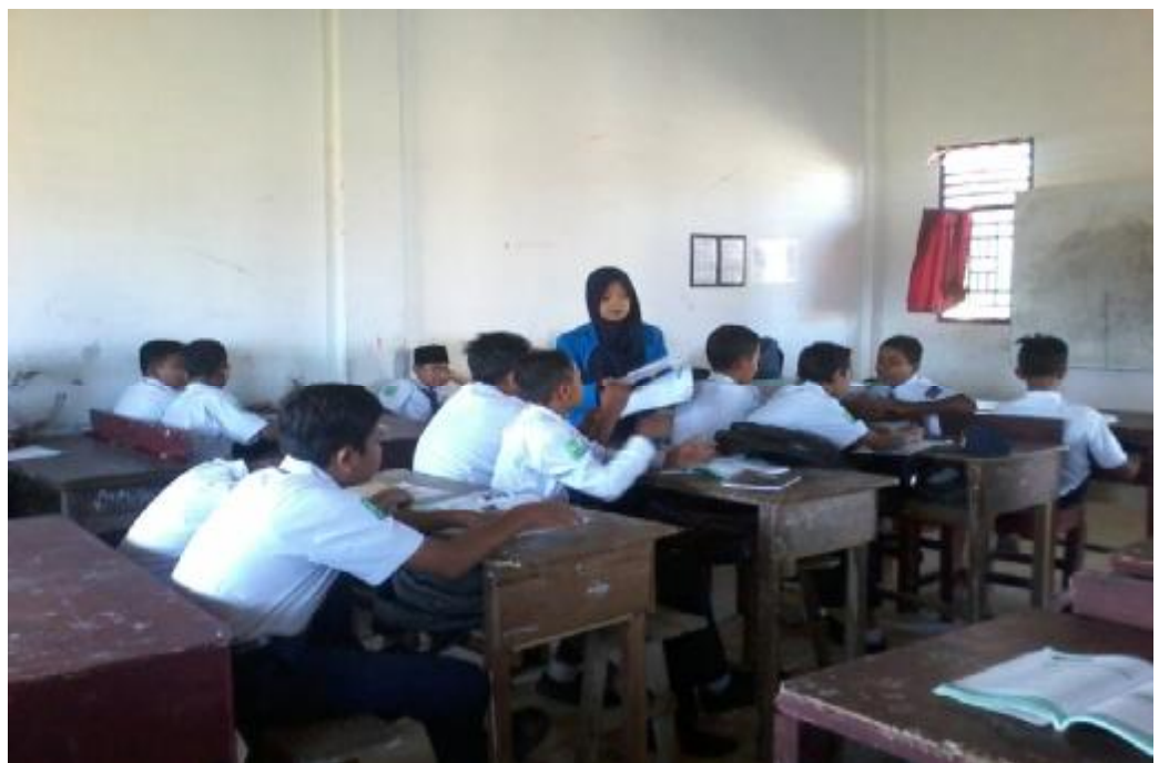
Siswa lain menyanggahnya