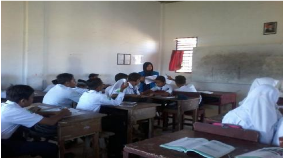
Guru membagikan soal kepada siswa