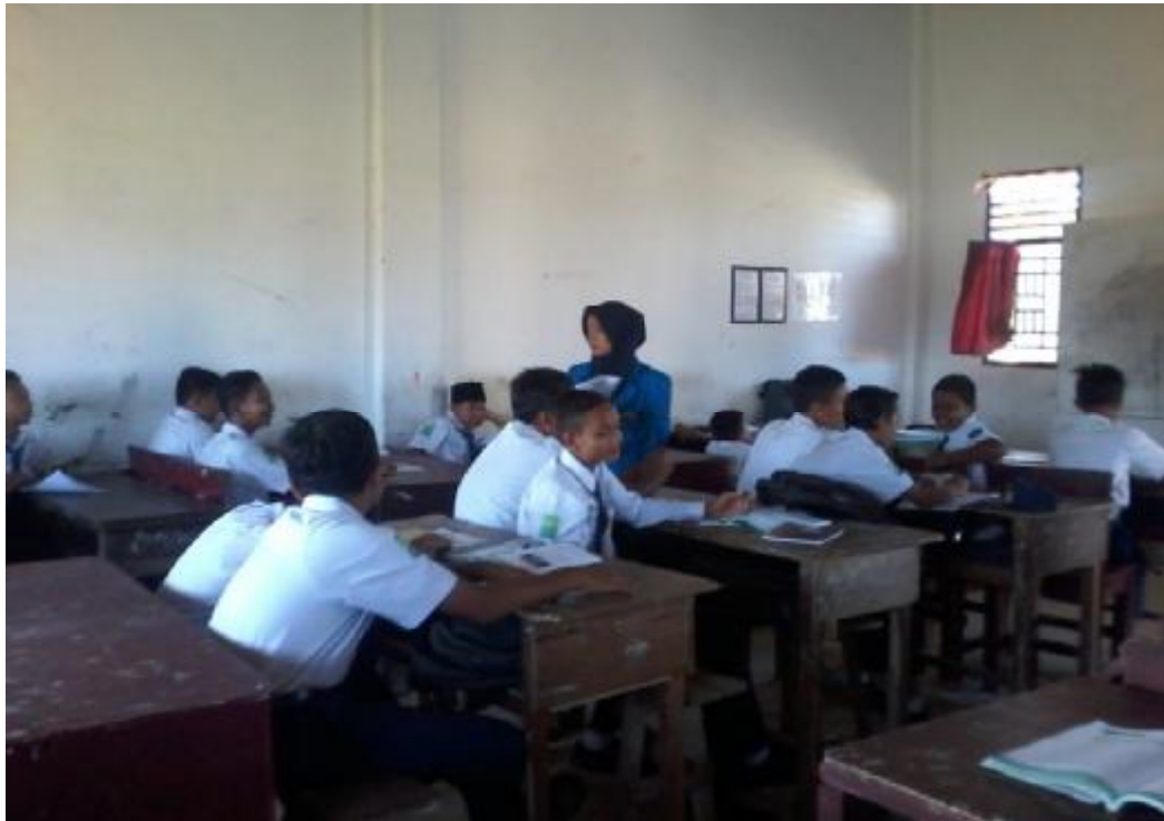
Siswa memberikan pendapatnya dalam melaksanakan metode debat