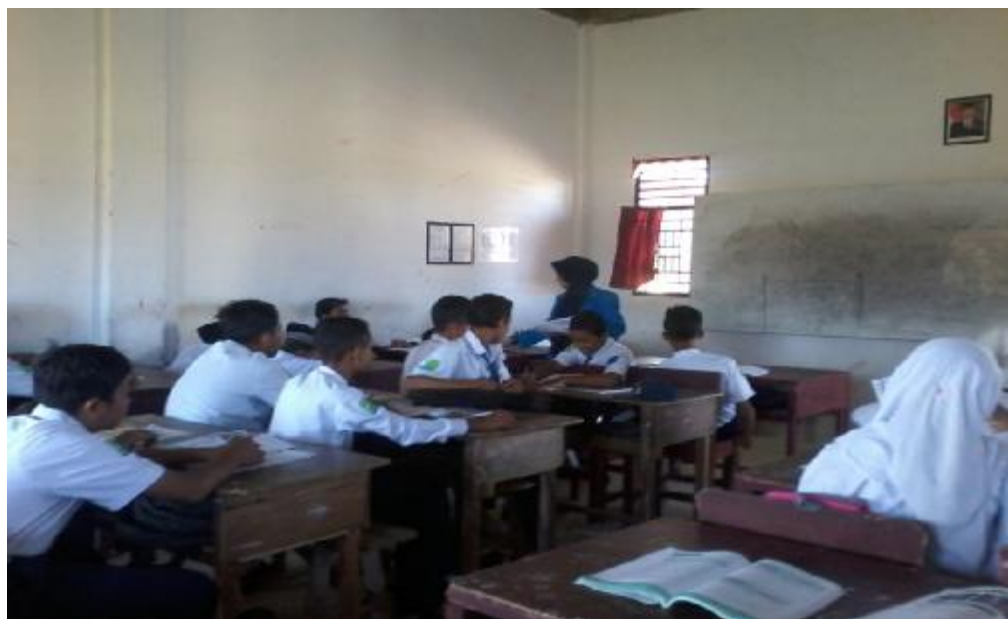
Siswa mengerjakan soal