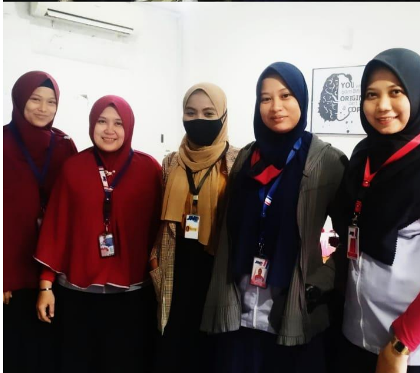
Staff/Karyawan PT. JNE Amplas Trade Center Medan