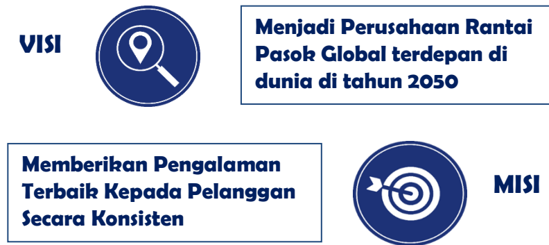
Gambar 3.3 Visi dan Misi

Artinya : Kita semua baik agen maupun manajemen JNE berusaha untuk memberikan pengalaman terbaik kepada pelanggan secara konsisten di setiap tahap. Paling tidak ada 4 tahap pengalaman yang harus dibangun dengan pelanggan: