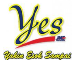
Gambar 3.6 Yakin Esok Sampai (YES)