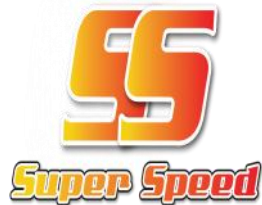
Gambar 3.5 Super Speed