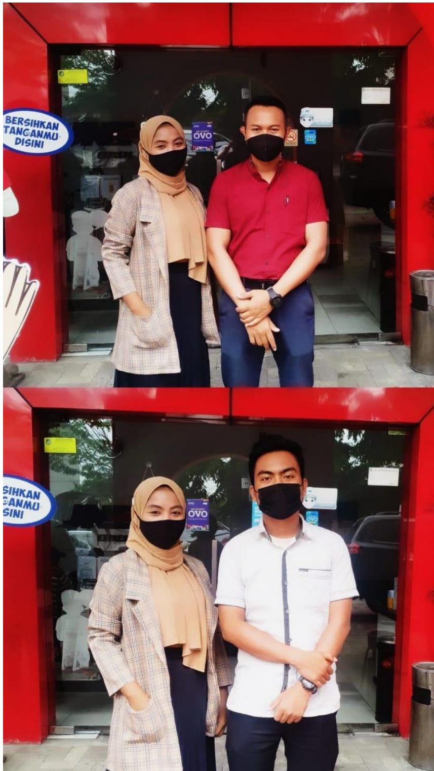
Customer penerima paket dari kurir PT. JNE cabang Amplas Trade Center Medan