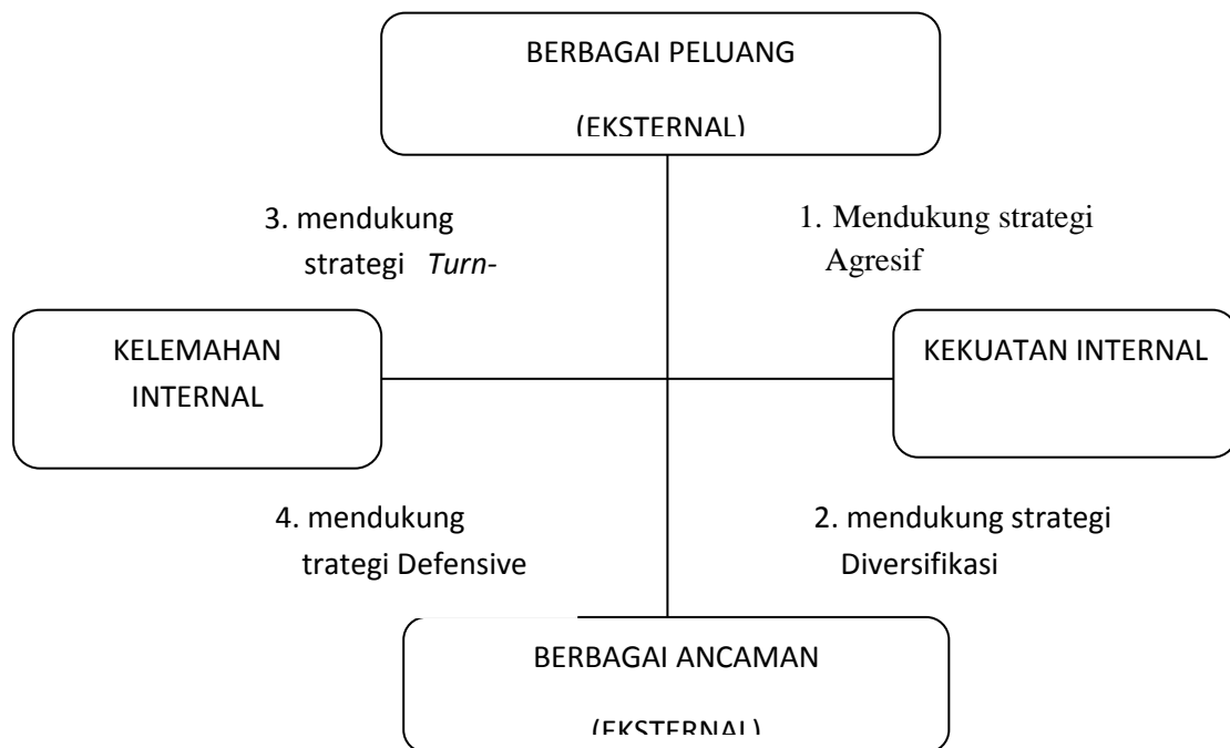
Gambar 2. Diagram Analisis SWOT

Kuadran 1 : Ini merupakan situasi yang sangat menguntungkan. Usaha tambak tersebut memiliki peluang dan kekuatan sehingga dapat memanfaatkan peluang yang ada. Strategi yang harus diterapkan dalam kondisi ini adalah mendukung kebijakan pertumbuhan yang agresif ( Growth oriented strategy ).