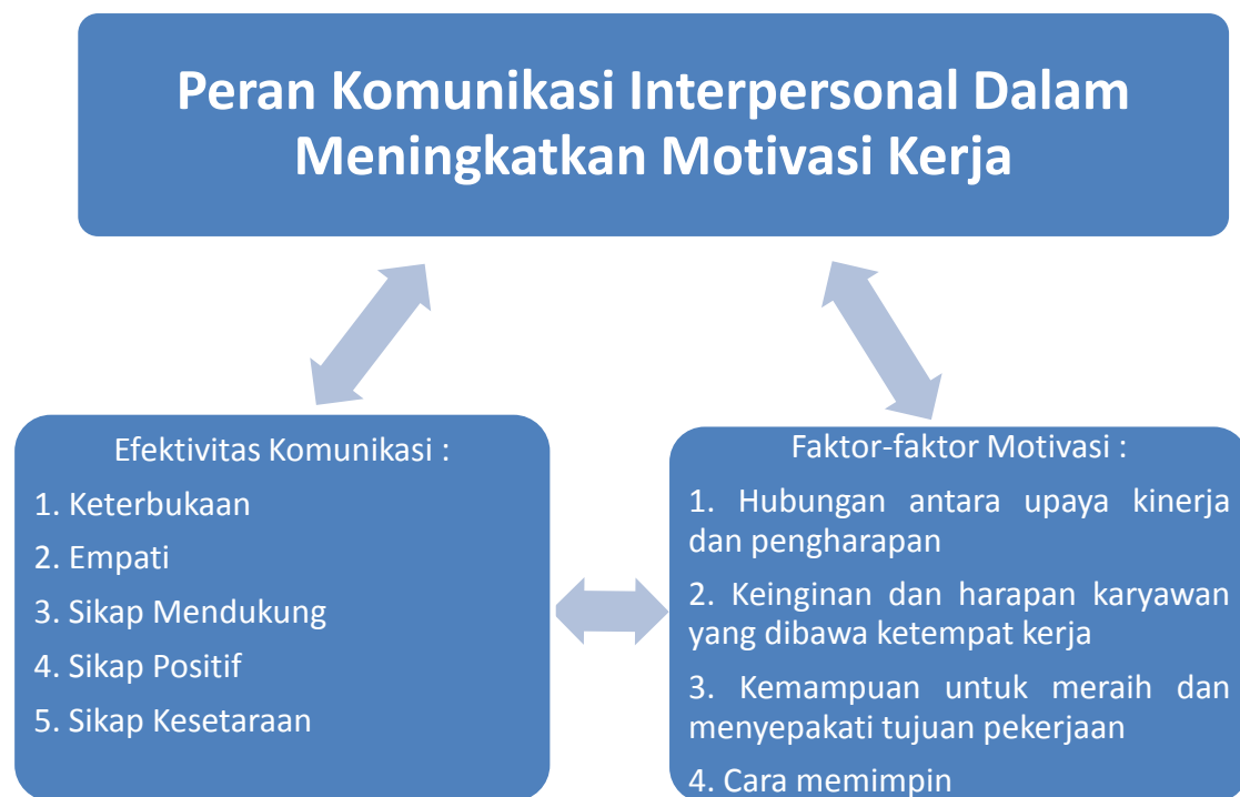
Gambar I Kerangka Konsep