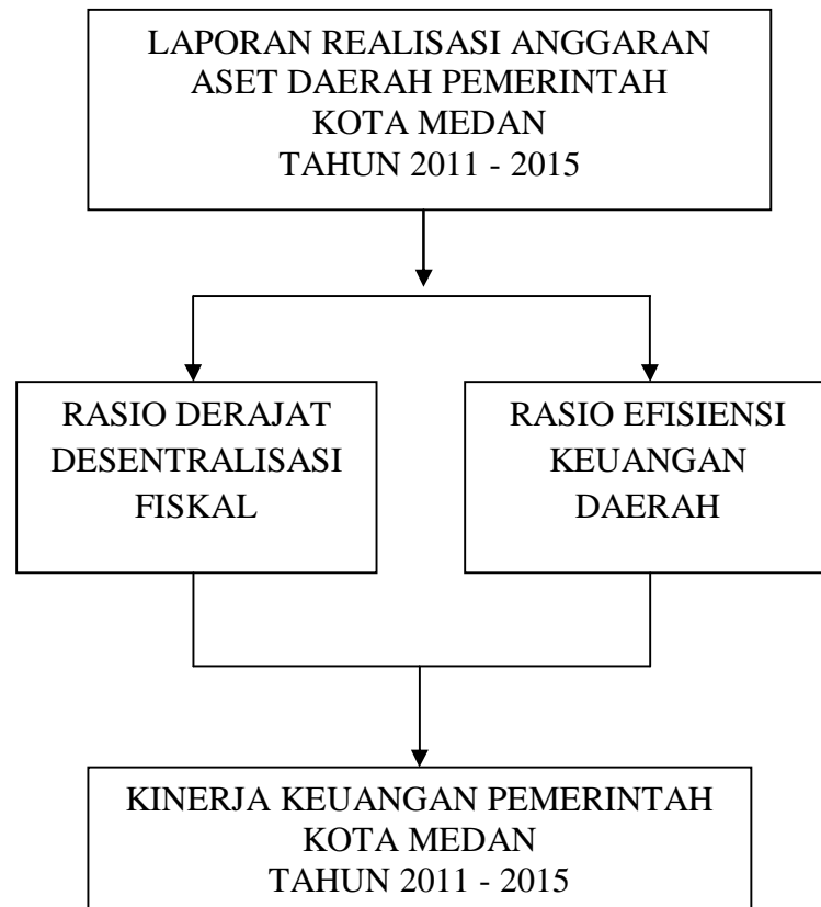
Gambar II. 1 Kerangka Berpikir

Dari penjelasan diatas, maka Peneliti dapat menggambarkan kerangka pemikiran penelitian, yaitu sebagai berikut: