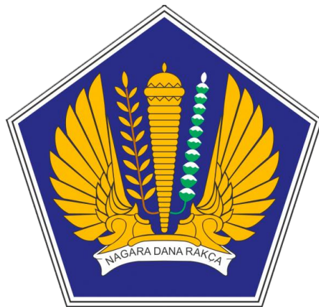
Gambar 1.2 Logo Kementerian Keuangan