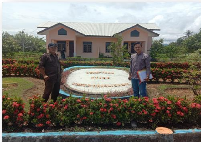
Gambar 3.1 Dokumentasi Asset perumahan PT Nauli Sawit

Judul penelitian ini adalah Peran Hubungan Masyarakat Dalam Mengkomunikasikan Program Corporate Social Responsibility PT Nauli Sawit Tapanuli Tengah. Dalam penelitian ini yang menjadi objek dari penelitian adalah program CSR dan Humas PT Nauli Sawit, yang tujuannya untuk mengetahui cara kerja dan tolak ukur dalam menyampaikan program CSR dari PT Nauli Sawit. adapun dasar dilakukannya penelitian ini ada karena kurangnya Informasi dan pengetahuan masyarkat di sekitaran perusahaan yang belum mengetahui program CSR dari PT Nauli Sawit Tapanuli Tengah.