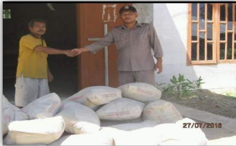
Gambar 4.5 Penyerahan bantuan pembangunan Rumah Ibadah