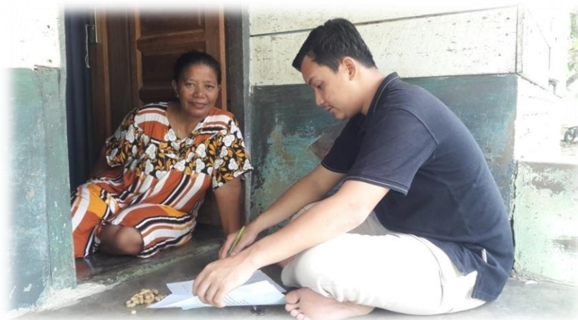
Gambar 2. Foto Wanita Tanam