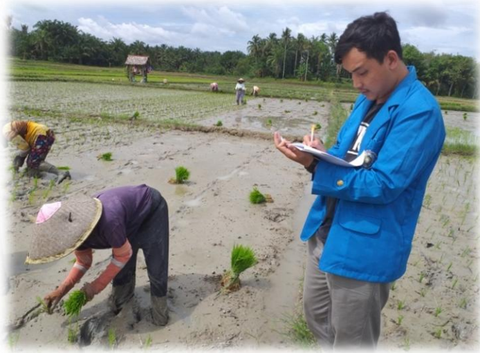
Lampiran 1. Foto Wanita Tanam Di Kecamatan Ujung Padang