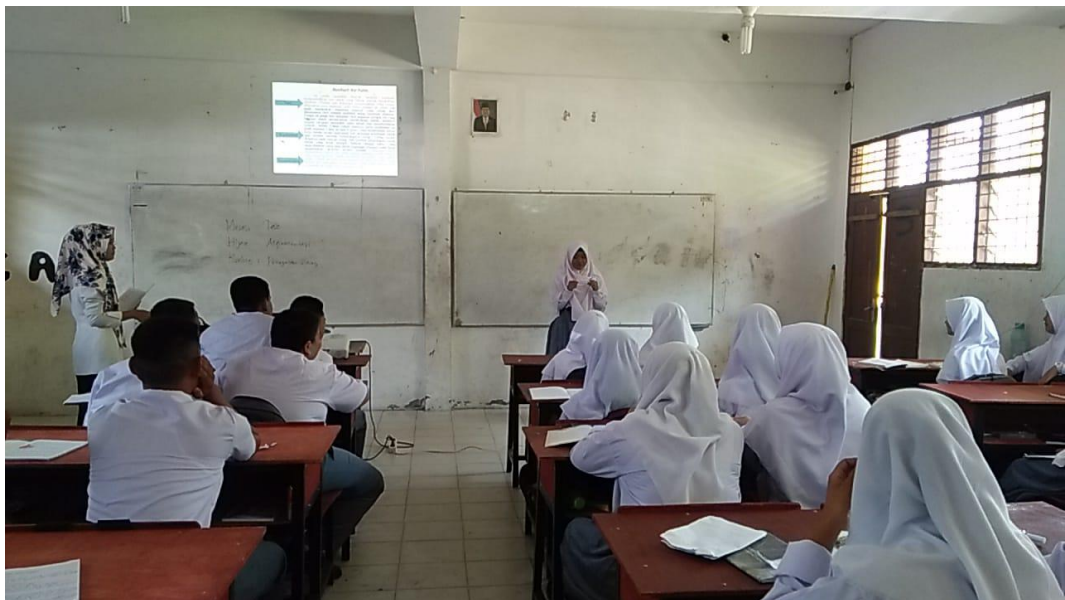
Gambar saat siswa maju kedepan membacakan dan menjawab kertas pertanyaan yang didapat selayaknya seperti seorang guru