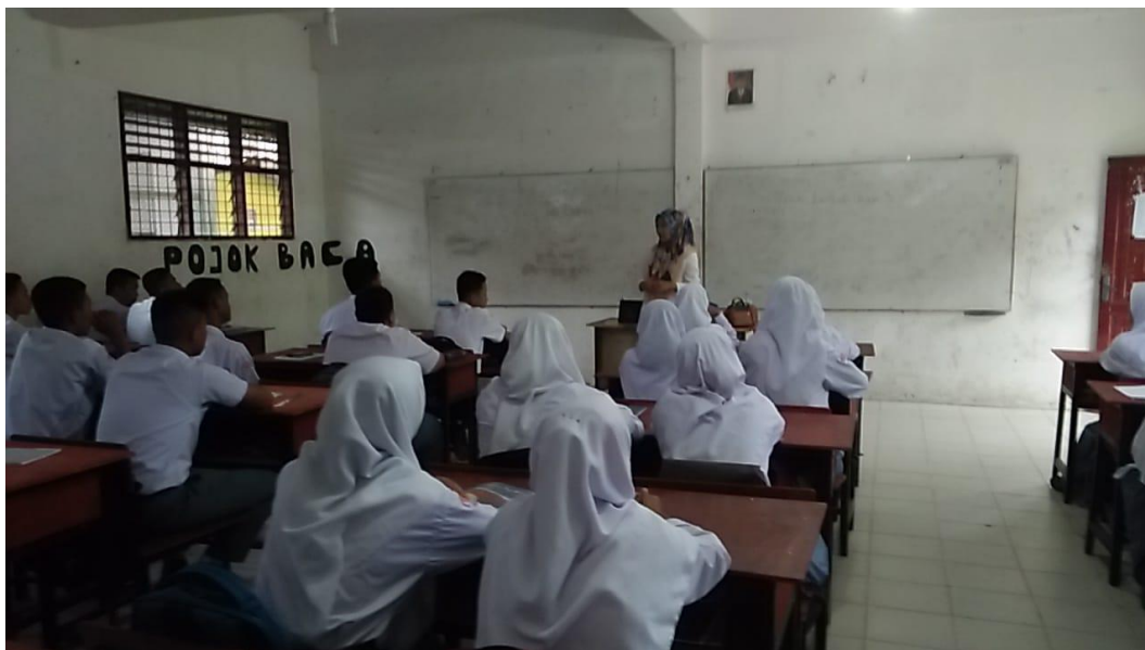
Gambar saat guru menyiapkan fisik dan Psikis siswa