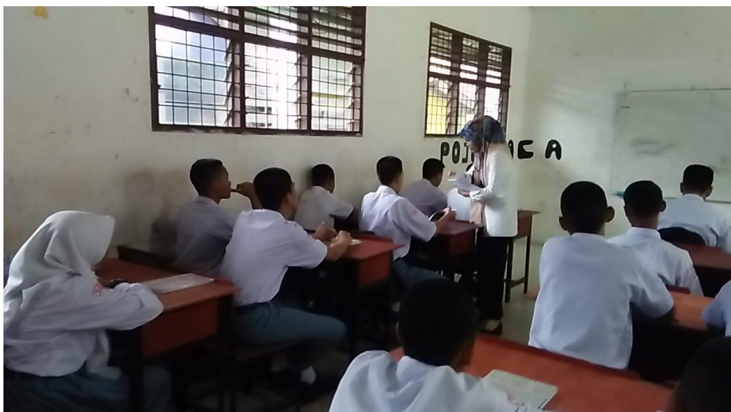
Gambar saat guru membagikan soal postes kepada siswa