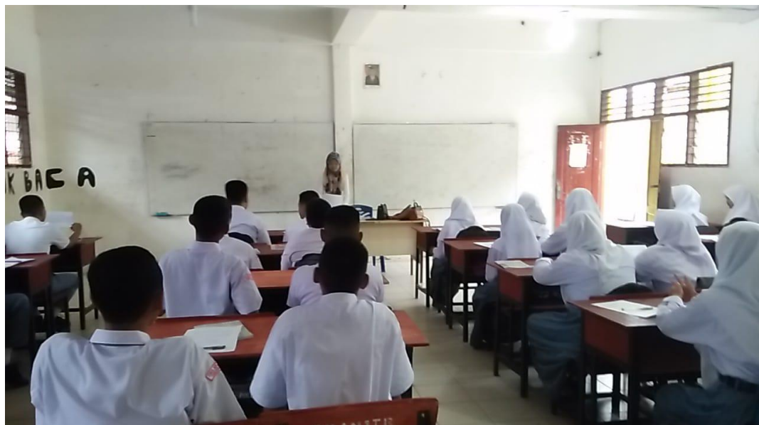
Gambar saat guru mengumpulkan hasil pretes yang dikerjakan oleh siswa