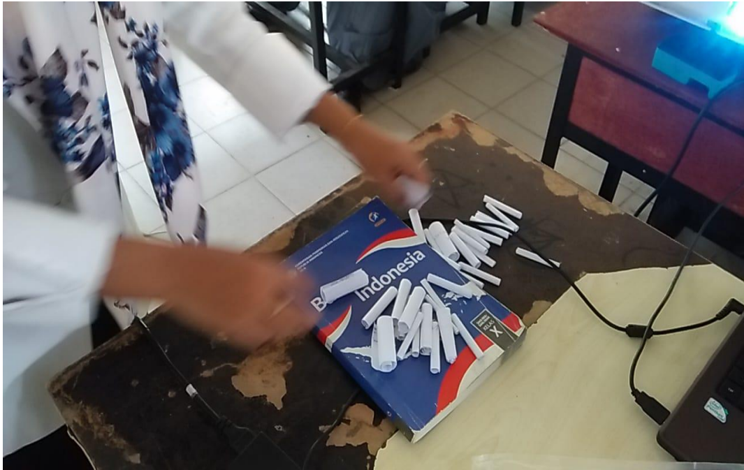
Gambar saat guru mengacak kertas pertanyaan yang sudah ditulis satu pertanyaan oleh siswa