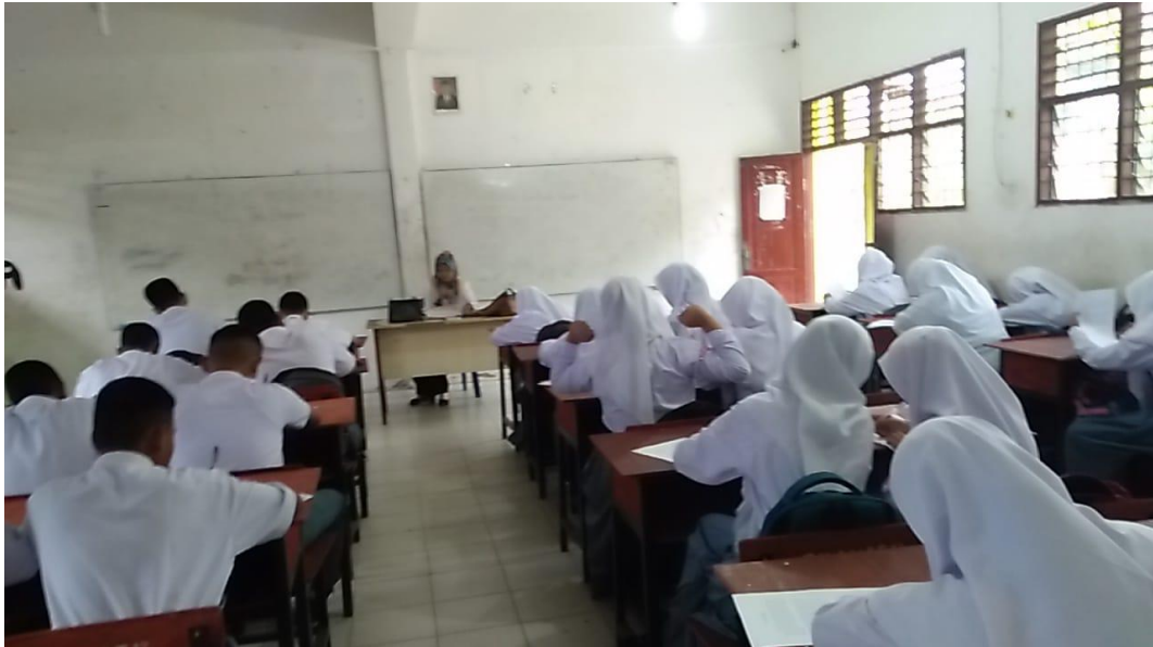
Gambar saat siswa mengerjakan soal postes