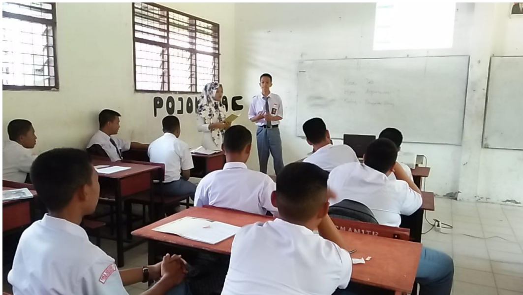
Gambar saat siswa maju kedepan membacakan dan menjawab kertas pertanyaan yang didapat selayaknya seperti seorang guru