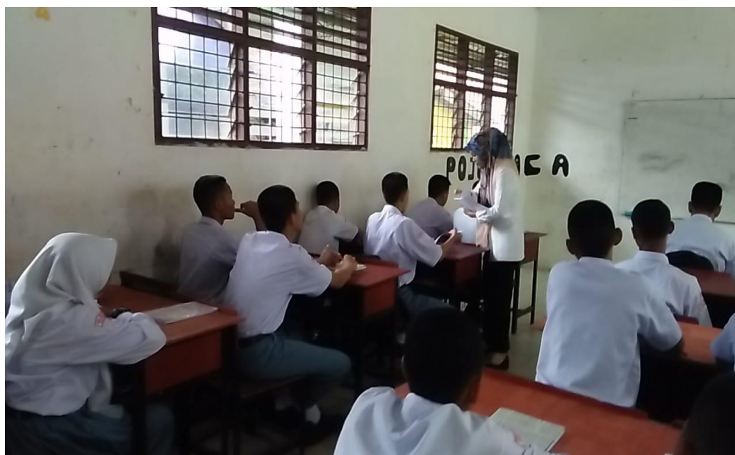
Gambar saat guru memberikan soal pretes kepada siswa