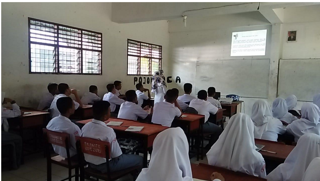
Gambar saat guru dan siswa menyimpulkan materi pembelajaran yang sedang dipelajari pada hari itu