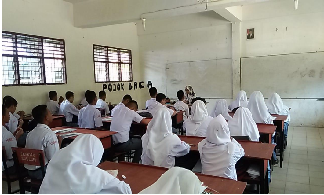
Gambar saat berdoa sebelum memulai proses belajar mengajar