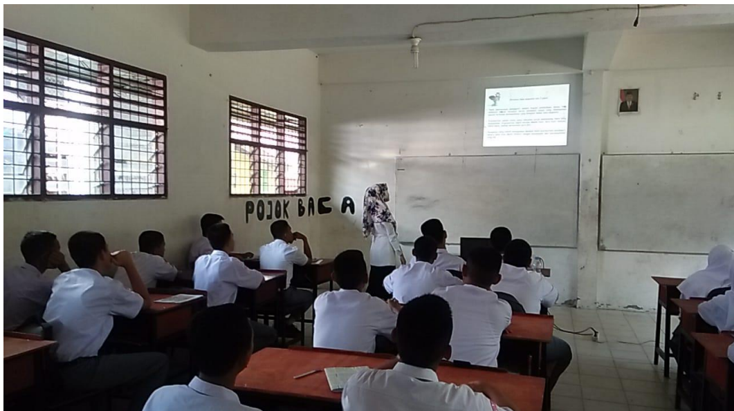
Gambar saat guru menyampaikan materi pembelajaran