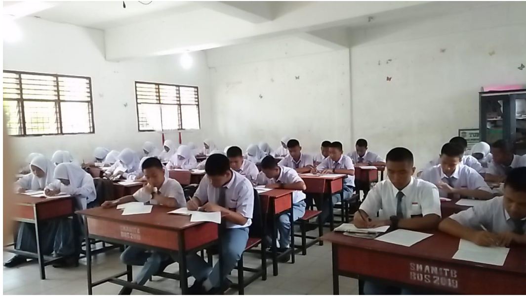
Gambar saat siswa mengerjakan soal pretes