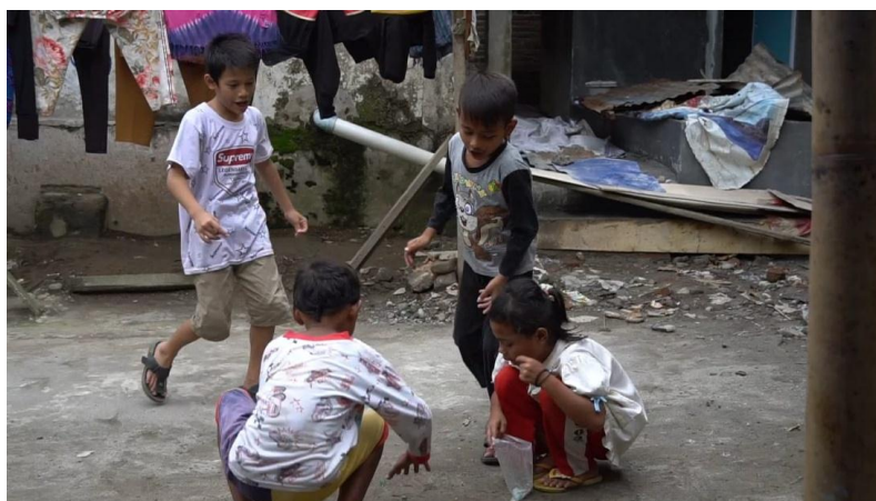
Gambar 4.2.2 bermain di sanggar

Sedangkan duka nya pasti merasa sedih ketika melihat anak-anak yang putus sekolah, karena setiap anak pasti memiliki impian untuk sukses dan berhasil menggapai cita-citanya, namun ketika mereka putus sekolah dan memilih untuk hidup tidak terarah serta bebas di jalanan akan membuat mereka rentan melakukan tindak kriminal, maupun narkoba. Atas dasar kekhawatiran itu akhirnya kopasude melakukan kerjasama dengan dinas pendidikan agar membuat ujian paket bagi anak-anak yang putus sekolah.