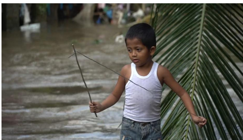
Gambar 4.4.1 bermain di Sungai Deli

Dari hasil wawancara informan 4, menjelaskan sedikit tentang rasa haru dan bahagia karena sudah banyak perubahan yang di jalani adik-adik siswa sekarang, sudah bisa berbaur dan menyapa orang lain, bermain di alam dan tidak merusak kawasan sungai, bahkan sering mengajak untuk belajar bersama. Mereka antusias ketika belajar dan bermain serta jarang sekali tidak hadir.