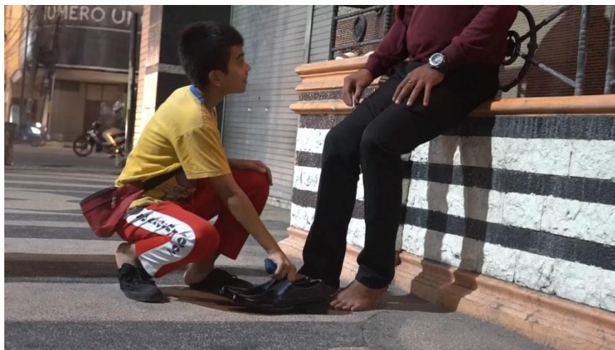
Gambar 4.3.1 Menyemir sepatu

Informan 3 mengatakan pola komunikasi yang di terapkan kepada adik-adik siswa tentunya bervariasi ada kalanya mereka harus patuh dengan aturan yang dibuat dan dihukum jika melanggar, adakalanya relawan melibatkan mereka bukan hanya sebagai pendengar saja. Pola komunikasi yang dibangun tentunya menyesuaikan kondisi. Komunikasi ini tidak hanya berlaku di ruang belajar tetapi saat berinteraksi di luar kelas, sehingga komunikasi yang tercipta di lingkungan kopasude tidak statis.