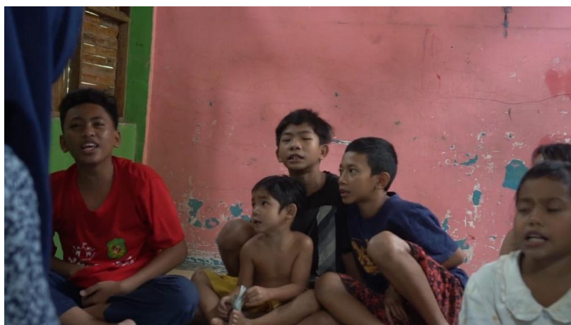
Gambar 4.2.1 Antusias siswa belajar

Dari hasil wawancara informan 2, menjelaskan sedikit perihal kegiatan belajar mengajar di kopasude yang di lakukan setelah sholat ashar hingga pukul 18.30 wib. Di luar dari pembelajaran di kelas dilakukan juga proses belajar dengan outing class yaitu dengan cara berkunjung ke ketempat-tempat yang bisa memberi wawasan dan ilmu bagi siswa, kita juga melakukan kegiatan belajar dengan cara diskusi dan tanya jawab, sehingga dengan cara itu maka pengetahuan siswa tak terbatas dari kakak relawan saja tapi juga dari sesama mereka, dari alam maupun orang-orang baru yang mereka temui.