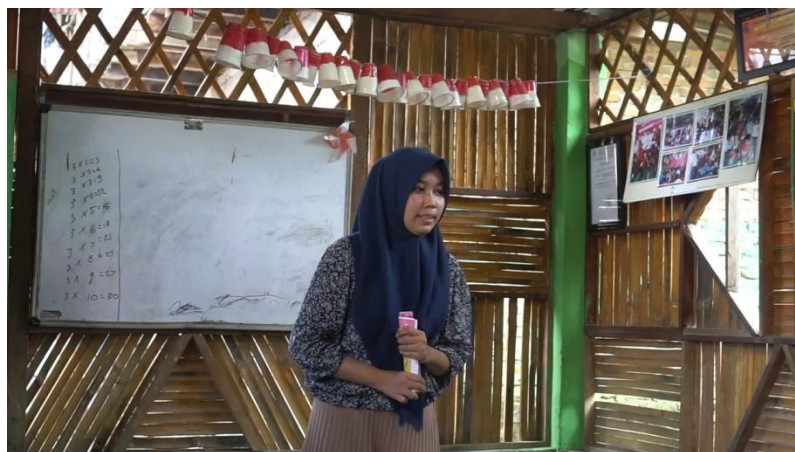
Gambar 4.1.1 kakak relawan menjelaskan materi pembelajaran

melihat kondisi dan situasi lingkungan sungai deli yang cukup memprihatinkan sehingga dirinya berkeinginan membuat sebuah lembaga yang awal mulanya diberi nama KOPASUS (komunitas peduli anak dan sungai) namun atas beberapa pertimbangan kemudian berganti menjadi KOPASUDE (komunitas peduli anak dan sungai deli) itu berdiri pada tanggal 22 maret 2014. KOPASUDE yang pertama kali dibuat sebagai komunitas kumpul-kumpul anak muda yang memiliki visi dan misi dalam konservasi alam dan sungai deli serta kepedulian terhadap anak, tepat di tahun 2016 di legalkan di bawah lembaga Kemenkumham menjadi yayasan kopasude.