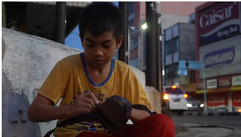
Gambar 4.4.2 bekerja di malam hari

Informan 4 juga beranggapan bahwa komunikasi dianggap efektif apabila terwujudnya tujuan dari komunikator, dan tujuan komunikator disini adalah agar adik-adik siswa mampu menjadi anak-anak yang berakhlakul kharimah dan sukses menggapai impiannya. Hal ini tidak terlepas dari bagaimana cara para relawan membangun komunikasi baik di dalam kelas maupun di luar kelas.