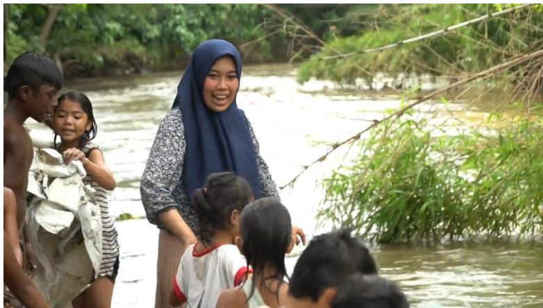
Gambar 4.2.3 kegiatan renang di Sungai Deli

Dari gambar di atas terlihat aktivitas yang dilakukan oleh relawan dengan belajar dan bermain di pinggiran sungai sebagai bentuk penerapan pola komunikasi multi arah agar siswa bisa saling berinteraksi, baik antara siswa dan relawan maupun sesama siswa. Sehingga pola ini memungkinkan para siswa berfikir kritis dan aktif dalam proses belajar mengajar, tetapi relawan juga tetap menjadi leader dan mengendalikan proses komunikasi ini. Sehingga efek dari proses pembelajaran ini bisa dirasakan langsung oleh adik-adik siswa.