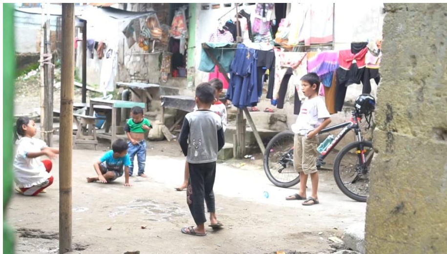
Gambar 4.1.2 bermain di halaman sanggar

siswa di kopasude di tahun 2020 sekitar 74 orang dari tingkat TK hingga SMA, namun sejak 2014 sudah banyak alumni siswa di kopasude yang melanjutkan pendidikan ke perguruan tinggi.