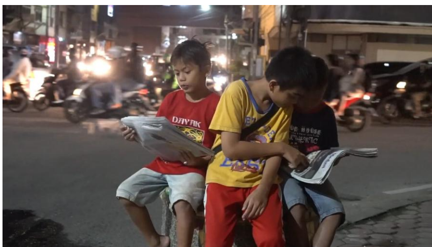
Gambar 4.4.4 bekerja berjualan Koran pada malam hari

dibuat menyenangkan maka siswa akan fokus mendengarkan apa yang akan disampaikan.