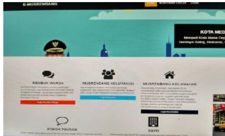
Gambar 2.2