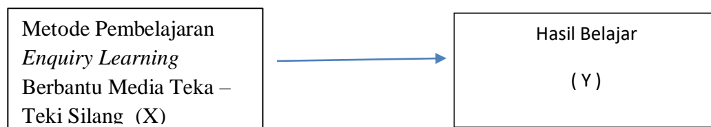
Gambar 2.2 Kerangka Konseptual

Berdasarkan uraian diatas maka paradig penelitian dapat di gambarkan sebagai berikut :