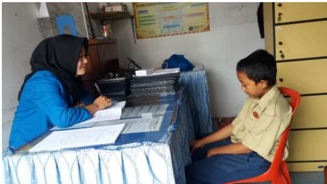
Saat Melaksanakan Layanan Konseling Individu Dengan RM