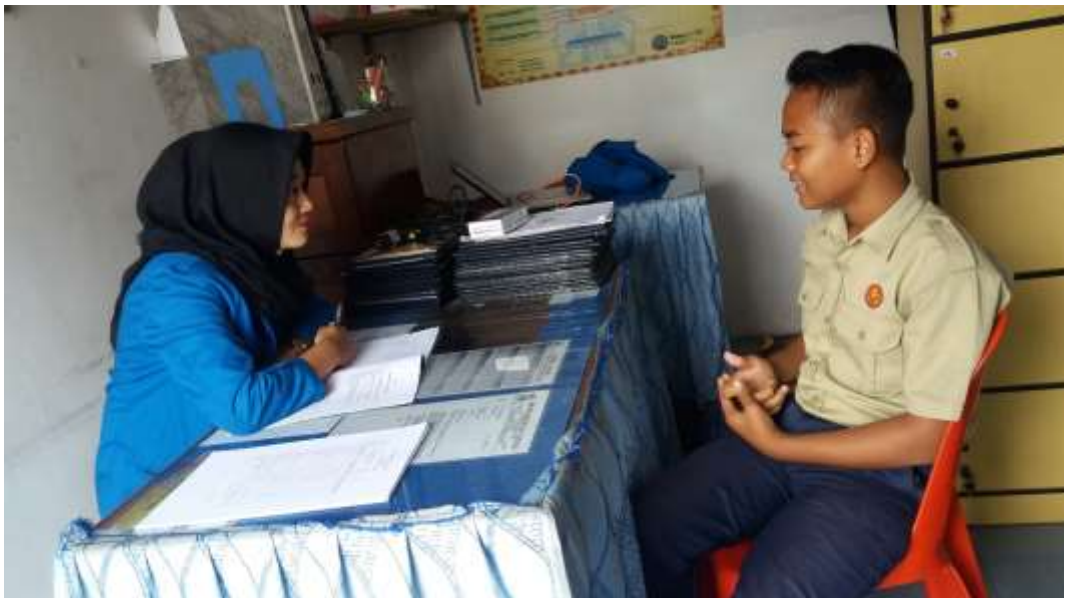
Saat Melaksanakan Layanan Konseling Individu Dengan HF