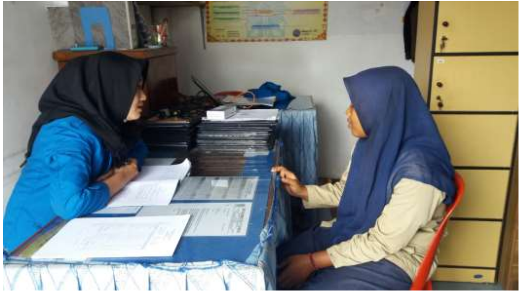
Saat Melaksanakan Layanan Konseling Individu Dengan DAS