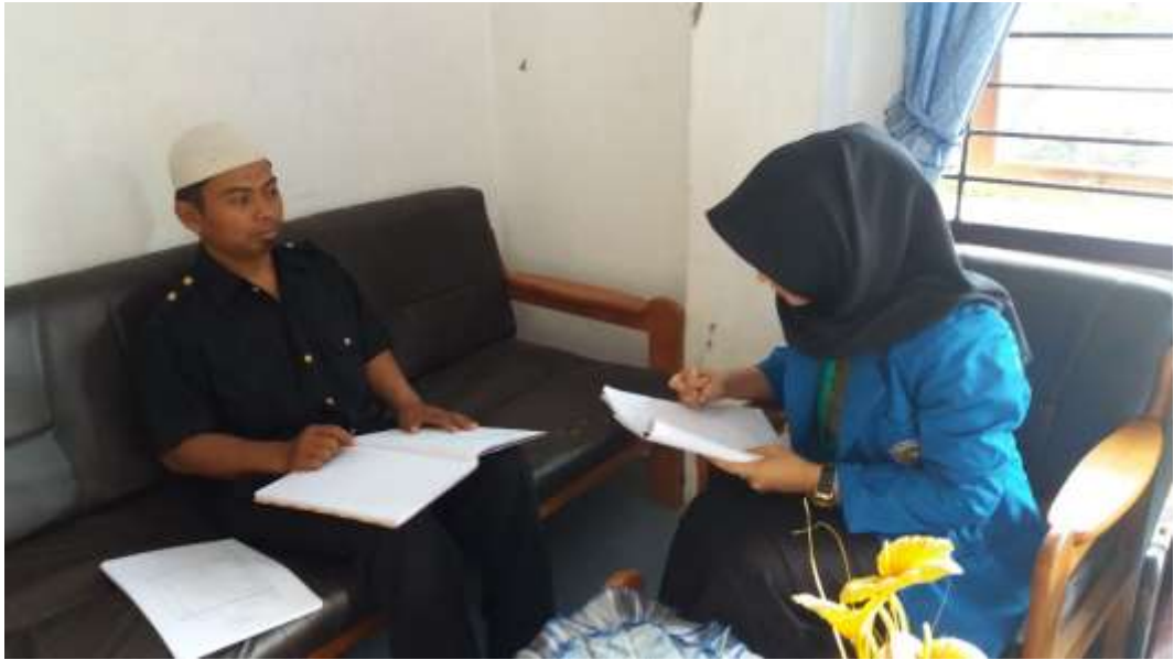
Saat Melakukan Wawancara Dengan Guru Bimbingan Dan Konseling