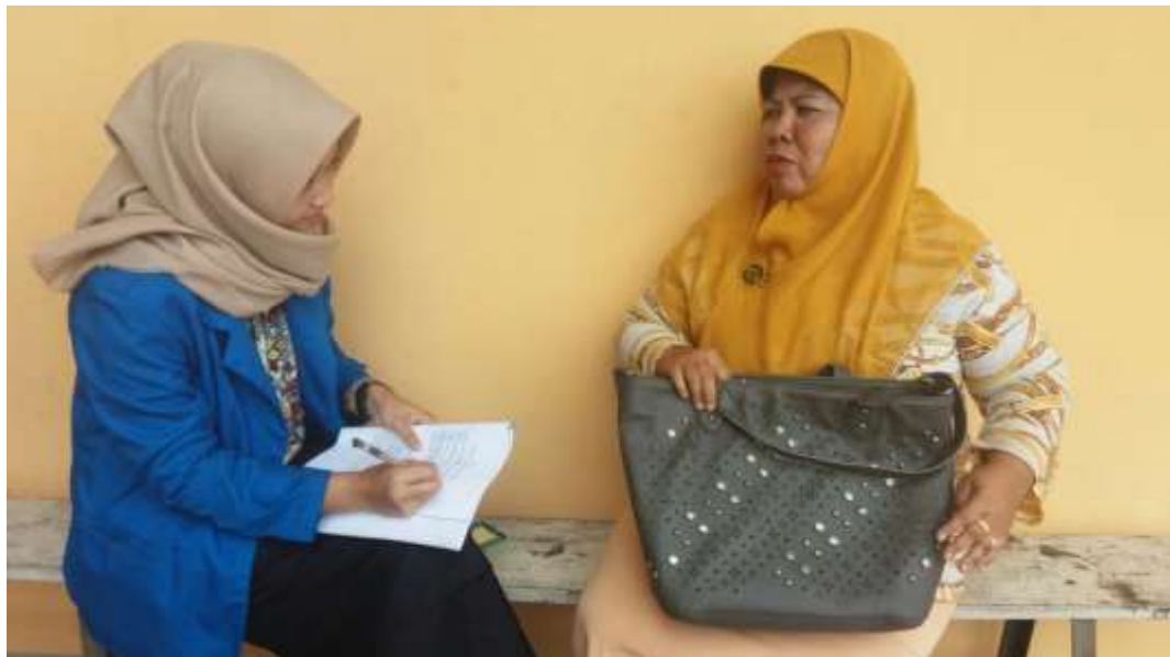
Saat Melakukan Wawancara Dengan Wali Kelas Kelas VIII-3