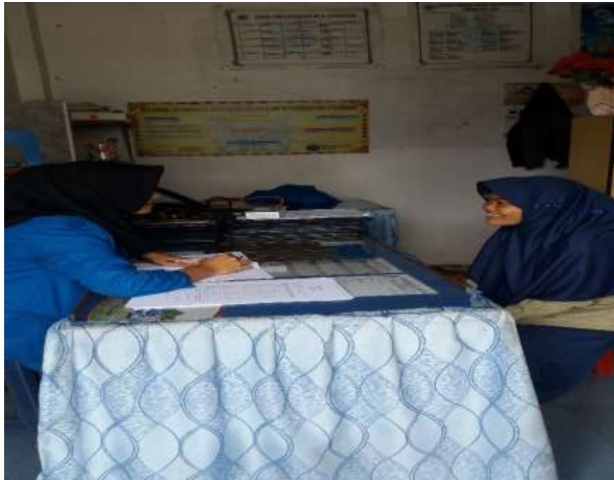
Saat Melaksanakan Layanan Konseling Individu Dengan NF