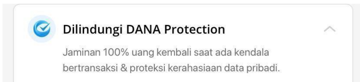
Gambar III.III Perlindungan Dana Protection Dari Aplikasi Dana 77

Investasi emas online yang dilakukan dari aplikasi Dana, maka Dana juga memberikan Dana Protection dapat dilihat dari aplikasi Dana yang dapat dilihat dari gambar berikut ini: