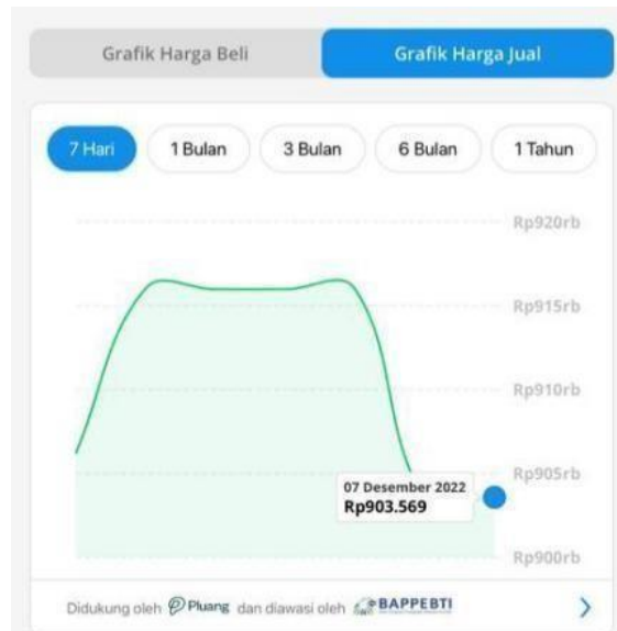
Gambar III.II Grafik Harga Jual Emas Pada Aplikasi Dana 59

Dari gambar grafik tersebut terdapat penurunan harga jual emas didalam gambar grafik aplikasi Dana pada tanggal 1 Desember 2022 sampai tanggal 7 Desember 2022 yang berkisar dari Rp.906.189 sampai Rp.903.569, Faktor penurunan harga yang berpengaruh terhadap harga emas adalah Bank Sentral AS The Federal Reserve yang cenderung hawkish atau agresif untuk menaikkan suku bunga acuan. Seperti yang dilansir oleh Bisnis Indonesia, emas telah mengalami penurunan harga yang berkepanjangan karena serangkaian kenaikan suku bunga yang sangat tajam oleh bank tersebut yang mendorong dolar dan imbal hasil obligasi pemerintah Amerika. 60