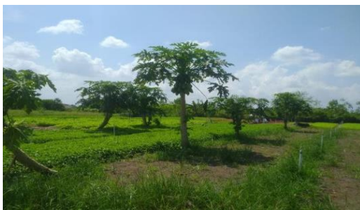
Tumpang Sari Pepaya California