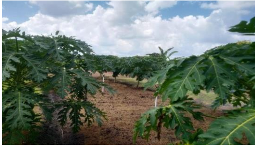
Pepaya California mulai berbuah.