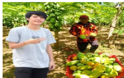
Panen papaya California