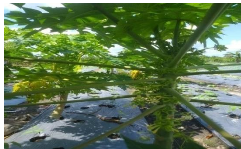
Pepaya California sedang berbunga