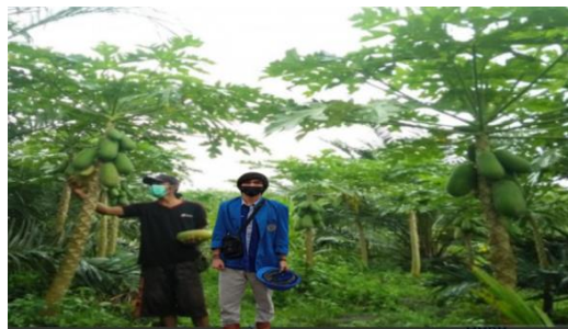
Kunjungan Ke kebun papaya California