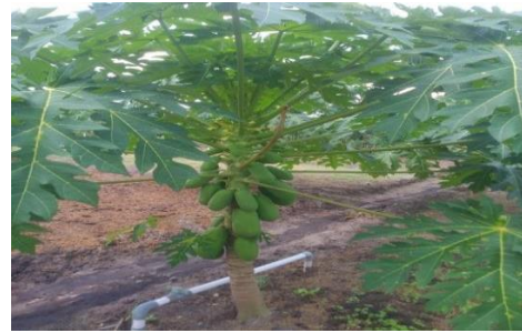
Pepaya California 1 tahun setelah tanam