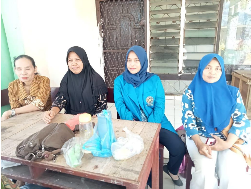
Dokumentasi Dengan Para Orangtua Siswa di SLB E Negeri Pembina Medan