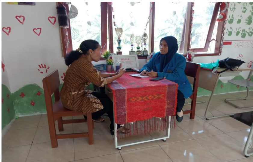
Dokumentasi Dengan Guru di SLB E Negeri Pembina Medan

Dokumentasi Dengan Kepala Sekolah SLB E Negeri Pembina Medan