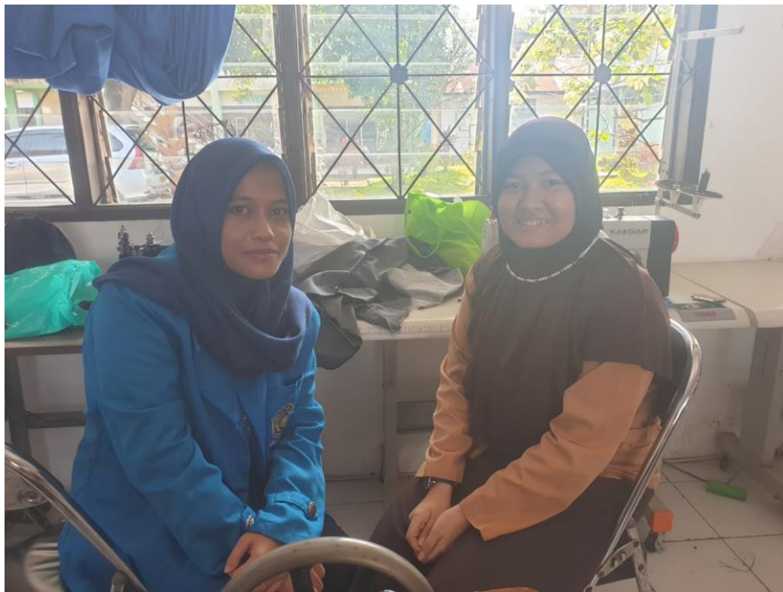
Dokumentasi Dengan Siswa Tunarungu di SLB E Negeri Pembina Medan