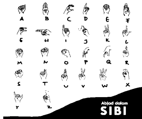
Gambar 4.2.1 Abjad Dalam SIBI