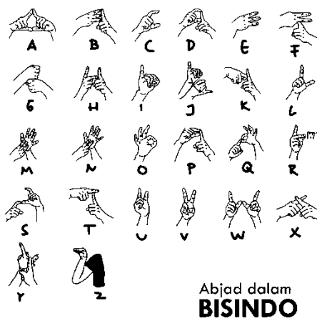
Gambar 4.2.1 Tabel Abjad BISINDO

Dengan pembelajaran bahasa isyarat ini, tidak hanya memudahkan bagi para guru dan anak tunarungu tetapi juga untuk orang tua. Secara alami orang tua akan ikut belajar tentang bahasa isyarat yang didapat anaknya disekolah sehingga dirumah tidak hanya menggunakan komunikasi verbal namun juga dengan tambahan bahasa isyarat.