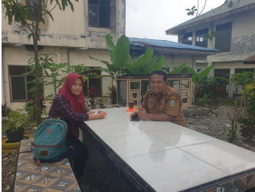
Dokumentasi penelitian di SLB E Negeri Pembina Medan

Dokumentasi Dengan Kepala Sekolah SLB E Negeri Pembina Medan