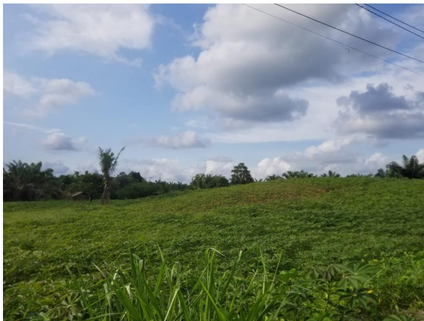
Tanaman Ubi Kayu