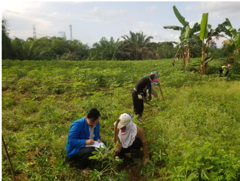
Dokumentasi dan Wawancara Bersama Petani Responden Ubi Kayu