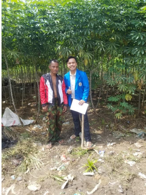
Dokumentasi dan Wawancara Bersama Petani Responden Ubi Kayu