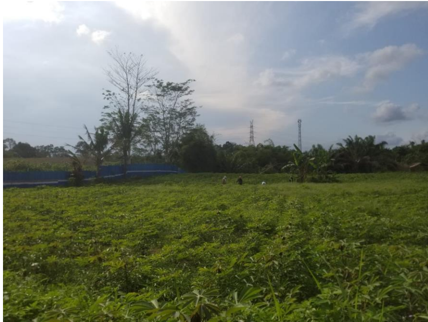
Tanaman Ubi Kayu