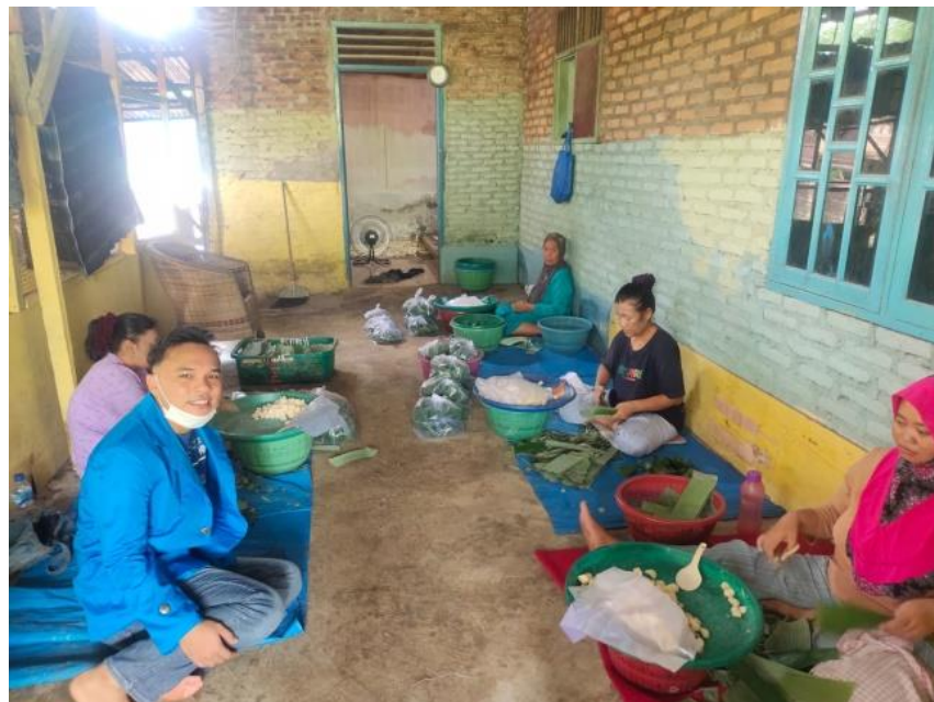
Dokumentasi Bersama Ibu Rumah Tangga yang Bekerja di UMKM Rumah Tape Prasetyo