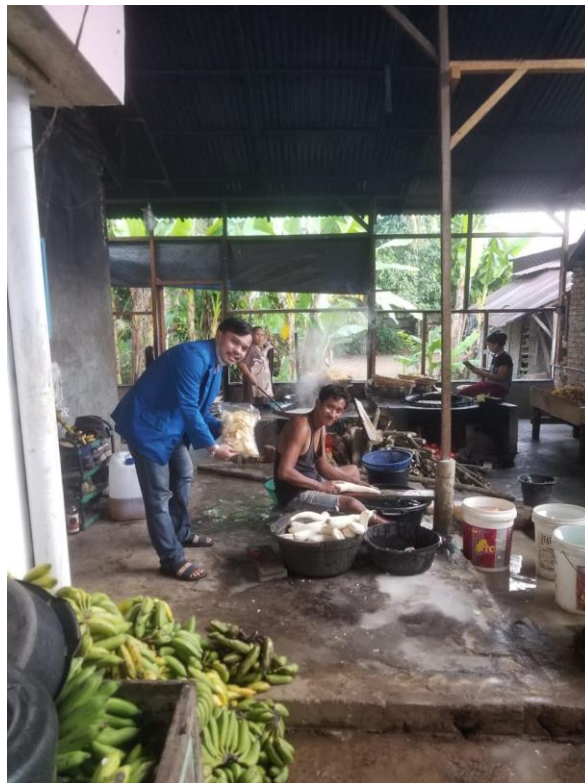
Dokumentasi dan Wawancara Bersama Petani Responden Ubi Kayu