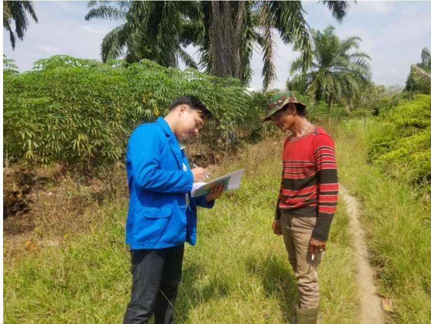
Dokumentasi dan Wawancara Bersama Petani Responden Ubi Kayu