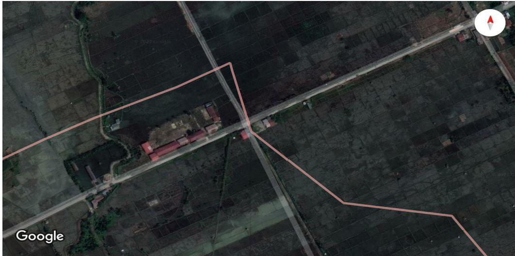
Gambar 3.2 Lokasi Pekerjaan Pelebaran Jalan

Lokasi penelitian berada di desa Rikit-Lawe Kinga Kab Aceh Tenggara Provinsi Aceh