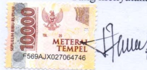
Adinda Nursabilla Purba