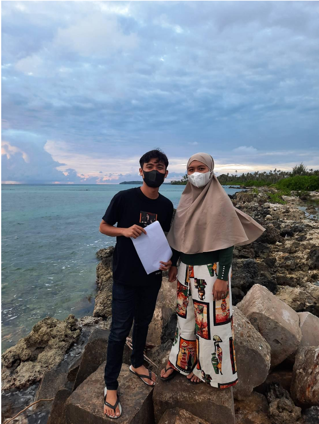
Wawancara kepada Kakak Pocut Intan