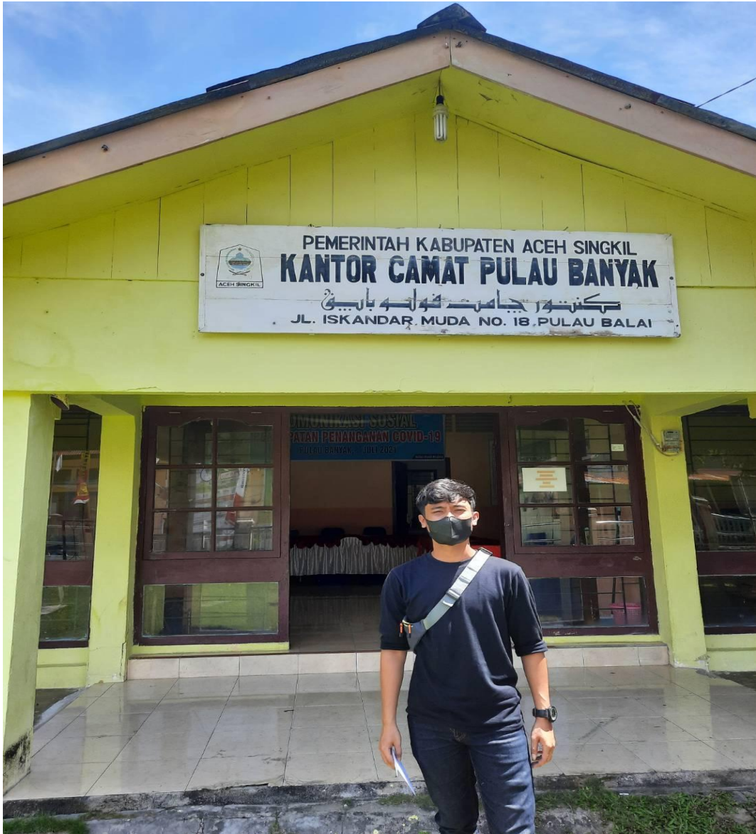
Depan Kantor Camat Pulau Banyak