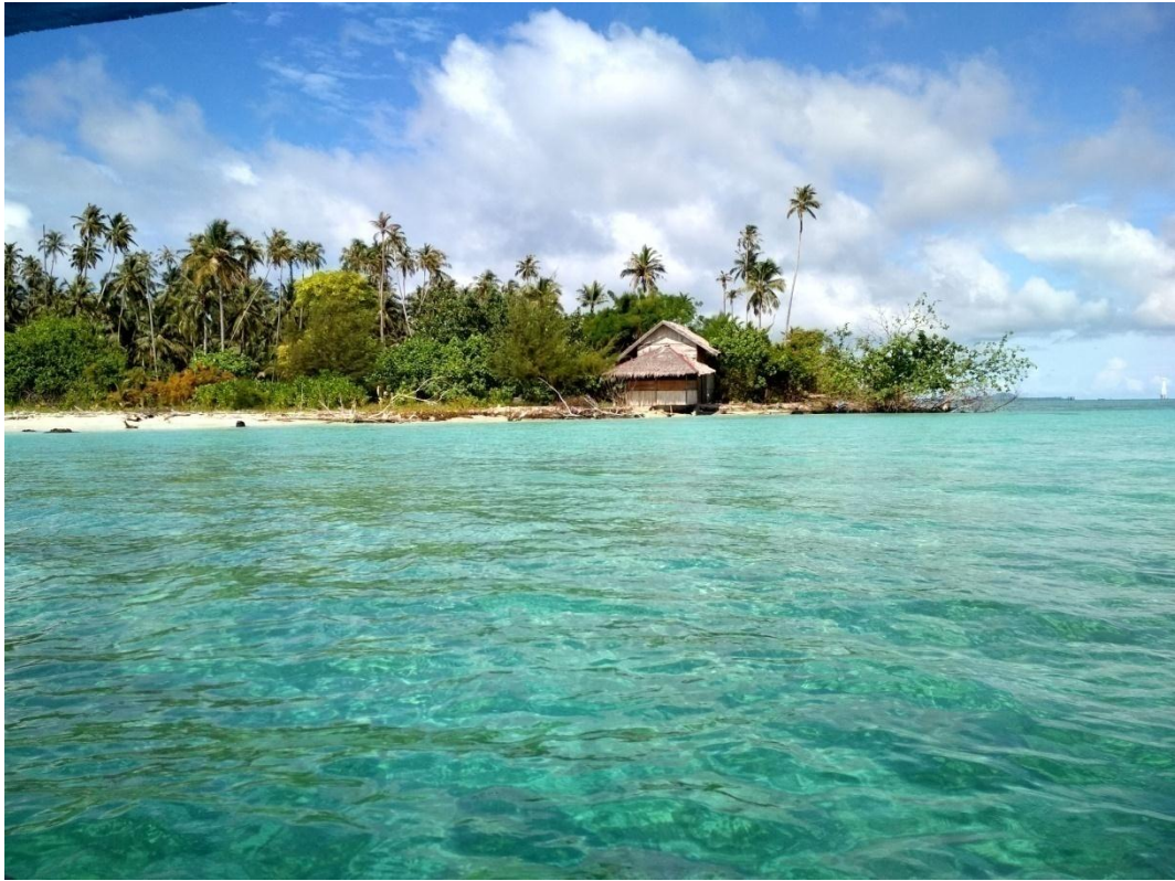
Laut Pulau Banyak