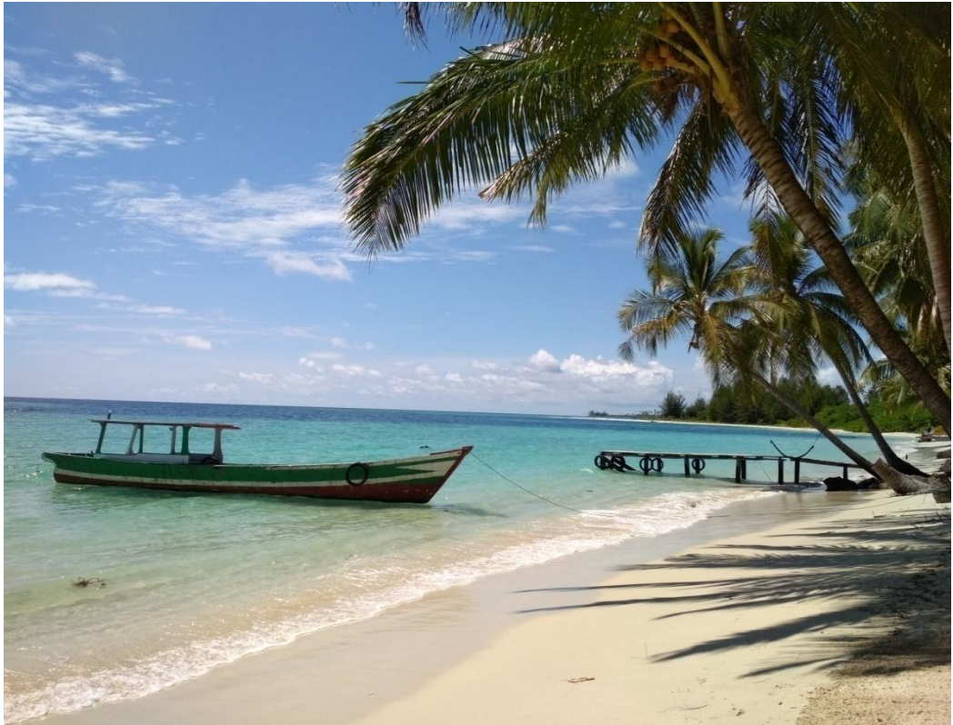
Pantai Pulau Banyak