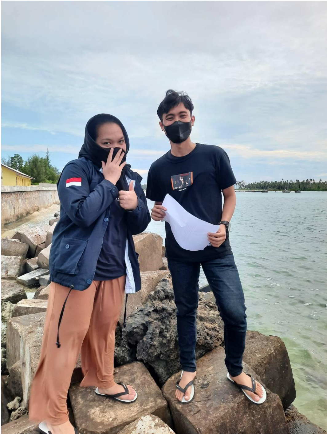
Wawancara kepada Kakak Soraya