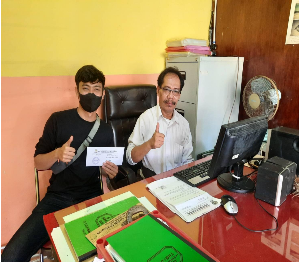
Penerimaan Surat Balasan Dari Sekretaris Camat Pulau Banyak