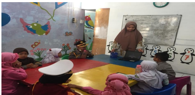
Gambar : Dokumentasi saat observasi

Penelitian ini juga didukung oleh dokumentasi yang memperlihatkan upaya yang dapat dilakukan untuk memotivasi anak dalam meningkatkan kemampuan menghafal Al-Qur'an pada anak dapat dilakukan dengan berbagai cara seperti dengan penggunaan media audio visual yang dapat memotivasi anak agar anak mau diajak untuk menghafal Al-Qur'an. Penggunaan media audio visual yang digunakan juga harus tepat agar hafalan anak juga terus bertambah sedikit demi sedikit. Mengajak anak bermain juga salah satu upaya agar anak tidak merasa bosan ketika menghafal, usia dini adalah usia anak untuk bermain. Ketika melakukan pembelajaran dengan anak juga harus dibarengi dengan bermain agar anak merasa pembelajaran yang dilakukan menyenangkan.