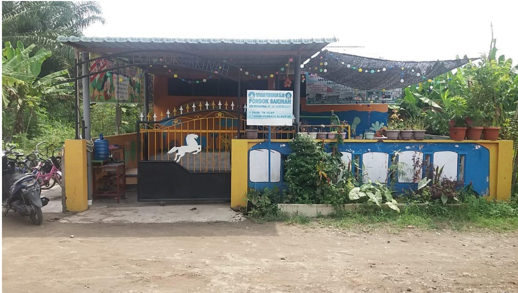
Kondisi Sekolah TK Islam Pondok Sakinah