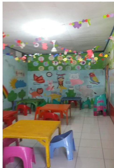
Ruang Kelas TK B