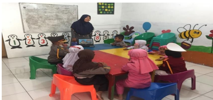
Gambar : Dokumentasi foto saat observasi

Penelitian ini juga didukung oleh dokumentasi yang memperlihatkan efektifitas penggunaan media audio visual dalam meningkatkan kemampuan menghafal Al-Qur'an pada anak kelompok B di TK Islam Pondok Sakinah. Penggunaan media audio visual ketika menghafal surah An-Naba' dan melakukan muraja'ah hafalan anak. Media audio visual yang digunakan adalah tayangan video animasi dengan lantunan ayat suci Al-Qur'an yang dilihat dan didengarkan anak. Guru menampilkan video surah An-Naba yang akan dihafal anak. Anak melihat dan mendengarkan lantunan ayat suci Al-Qur'an yang diputar. Anak sangat senang melihat gambar yang ditampilkan dan mendengarkan dengan baik. Hanya saja media audio visual yang digunakan kurang mendukung karena tidak terlihat oleh semua anak. Suara yang dihasilkan juga tidak begitu jelas, maka guru tetap harus melafalkan kembali kepada anak agar anak dapat menghafal surah An-Naba' dengan benar.