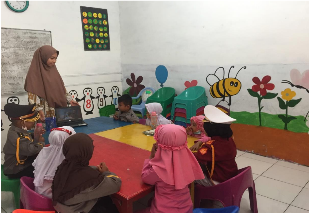
Penggunaan Media Audio Visual