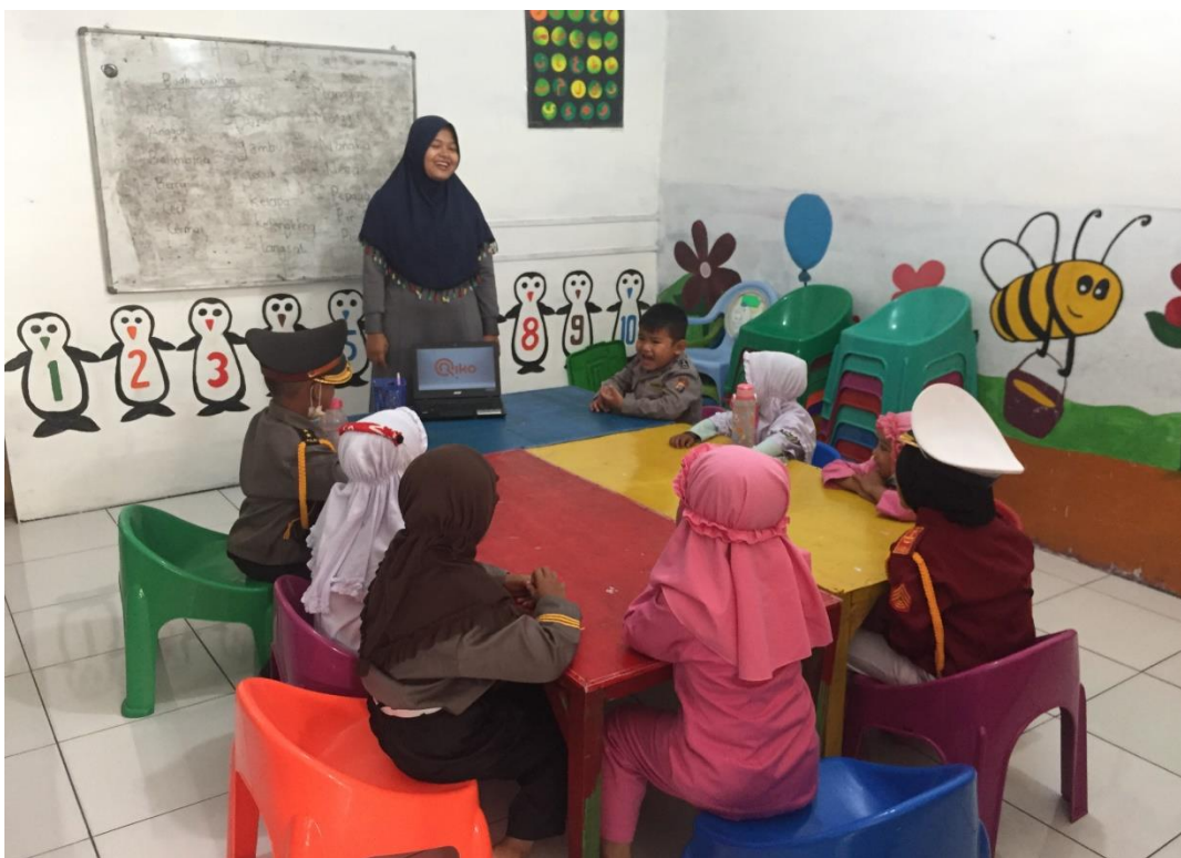
Penggunaan Media Audio Visual dalam Menghafal Al-Qur'an