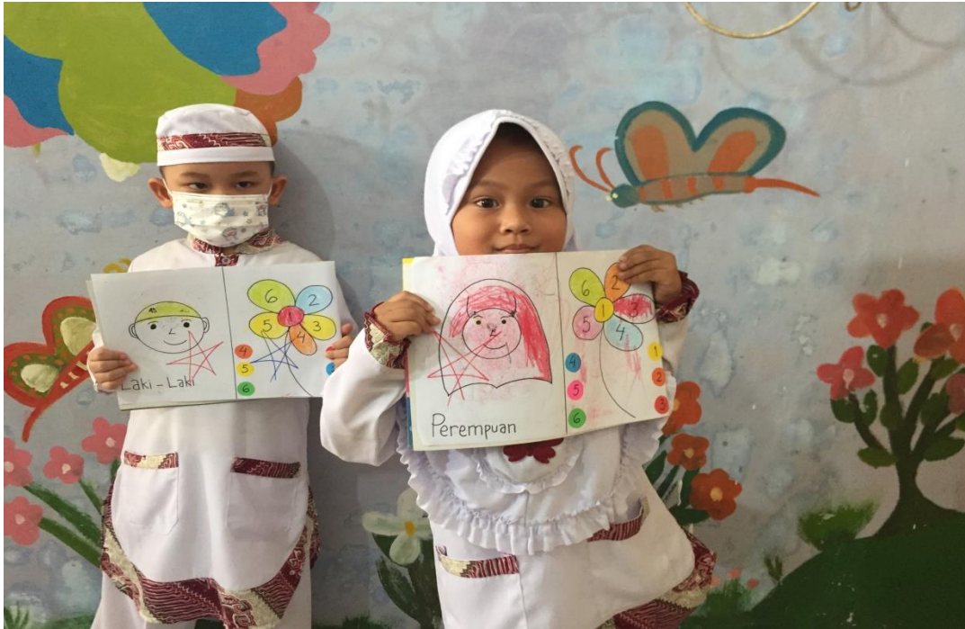
Kegiatan pembelajaran Anak