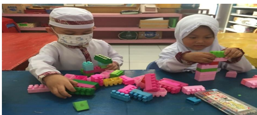
Gambar : Dokumentasi saat Observasi