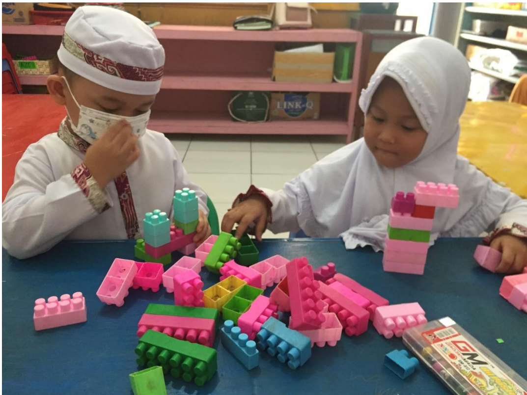
Kegiatan bermain sambil belajar