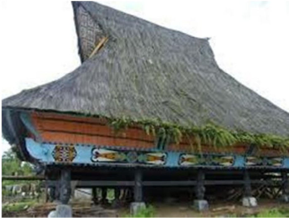
Gambar 5. Bangunan Adat “Sapo Ganjang Atau Sapo Page” di Desa Lingga Kab. Karo.