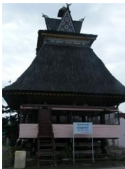
Gambar 4. Bangunan “Kantur” di Desa Lingga Kab. Karo

Desa, untuk memecahkan berbagai masalah, letaknya di sebelah timur dari "rumah raja". Bentuknya lebih jauh lebih kecil dibandingkan siwaluh jabu.