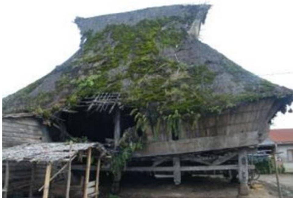
Gambar 7. Bangunan Adat “Lesung” di Desa Lingga Kab. Karo.

Lesung ini terletak dalam sebuah bangunan berpanggung yang tidak berinding. Bangunan ini mempunyai enam buah tiang-tiang besar, tiga sebelah kanan yang disebut binangun Pinem. Di sebelah atas terdapat tiga buah tiang yang membujur ke belakang tekang. Di antara tekang dan Binangun Pinem terdapat tiga lembar papan tebal sebagai penghubung supaya kuat. Di atas tekang terdapat empat buah tiang yang disebut tula-tula, dan sebuah tiang yang menjulang ke atas atap disebut tunjuk langit. Pada tunjuk langit ini terdapat tiga buah tiang memalang dan lima buah yang sejajar dengan tekang yang disebut pamayong. Antara tekang dengan binangun pinem terdapat kain putih, yang gunanya untuk menghormati roh-roh penjaga rumah. Dan untuk penyangga tiang supaya jangan mudah ambruk apabila angin topan datang, sehingga bangunan tidak mudah roboh.