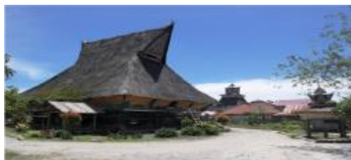
Gambar 2. Rumah Adat Karo “Siwaluh Jabu” di Desa Lingga Kab. Karo.

Perkampungan Karo zaman dulu memiliki beberapa bangunan adat selain rumah adat Siwaluh Jabu, diantaranya yaitu Jambur, Sapo Ganjang/page, Geriten, Lesung, dan Kantur-Kantur. Semua bangunan adat ini menjadi pelengkap kebutuhan ruang masyarakat Karo pada zaman dulu, yang kesemuanya terbuat dari kayu dan beratap ijuk. 35 Rumah adat berupa rumah panggung, tingginya kira-kira 2 meter dari tanah yang ditopang oleh tiang, umumnya berjumlah 16 buah dari kayu ukuran besar. Kolong rumah sering dimanfaatkan sebagai tempat menyimpan kayu dan sebagai kandang ternak.