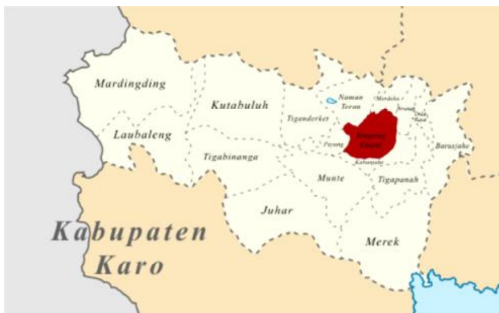
Gambar 1. Peta Lokasi Desa Lingga di Kec. Simpang Empat, Kab. Karo

Desa Lingga merupakan bagian dari wilayah kecamatan Simpang Empat kabupaten Karo. Berjarak \pm 4,5 Km dari arah barat Kantor camat Simpang Empat dan berjarak \pm 12 Km ke arah ibu kota kabupaten, dengan batas-batas sebagai berikut: