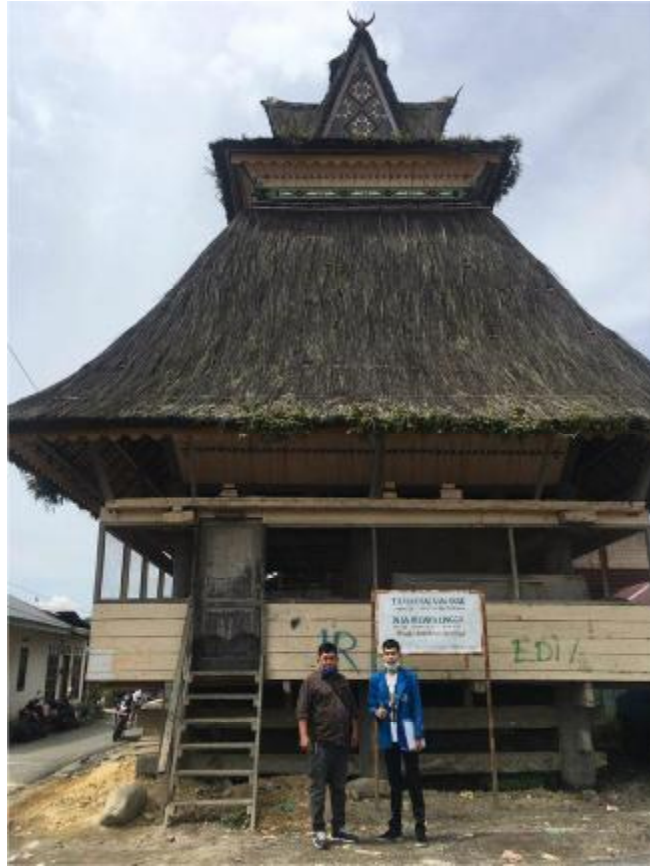
Gambar 1. Foto bersama dengan Kepala Desa Lingga di Depan Kantor Desa Adat