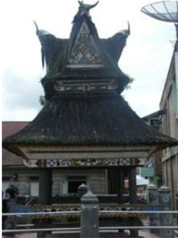
Gambar 6. Bangunan Adat “Geriten” di Desa Lingga Kab. Karo.