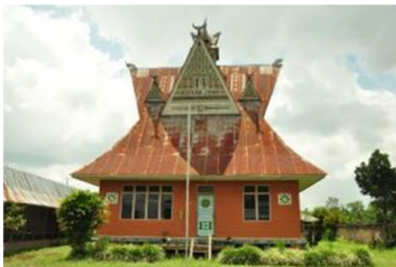
Gambar 8. Bangunan “Museum Lingga” di Desa Lingga Kab. Karo.

Berdasarkan hal tersebut, akan tetapi saat ini kebanyakan dari bangunan-bangunan di atas telah punah dan tidak bisa ditemukan lagi di Desa Lingga, yang tersisa hanya beberapa saja antara lain beberapa rumah siwaluh jabu, griten, kantor-kantor dan Museum Lingga yang dibangun paling belakangan. Walaupun bangunan adat di desa Lingga Kab. Karo sudah mulai punah sebagian, akan tetapi desa adat lingga di Kab. Karo kedudukannya sangat diakui sebagai salah satu desa adat dalam sistem pemerintahan desa di Indonesia. Sehingga dengan demikian, maka dapat dikatakan bahwa desa adat Lingga di Kab. Karo eksistensinya hingga saat ini masih tetap hidup.