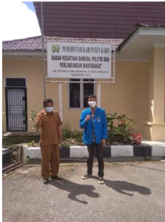
Gambar 4. Foto bersama dengan perwakilan pada Badan Kesatuan Bangsa, Politik dan Perlindungan Masyarakat Kabupaten Karo.