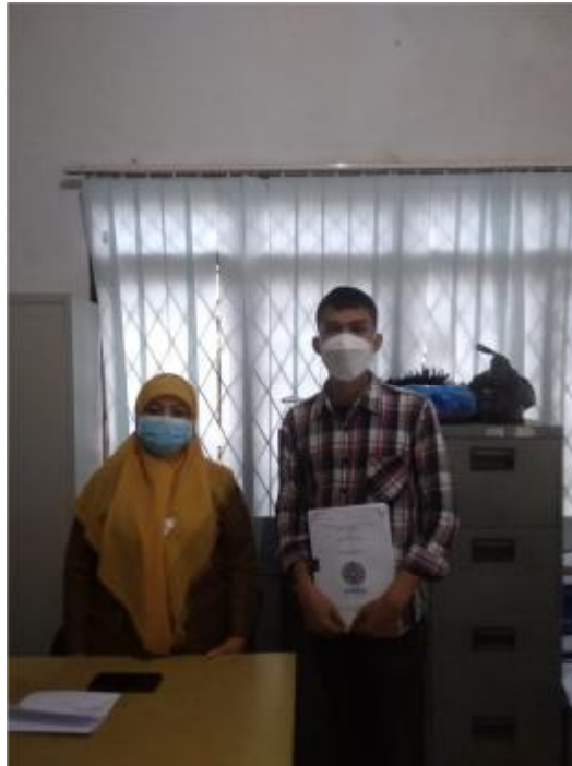
Gambar 3. Foto bersama dengan perwakilan pada Dinas Kebudayaan dan Pariwisata Kabupaten Karo.