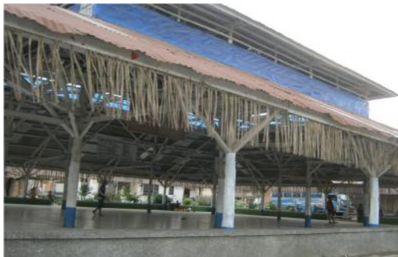
Gambar 3. Bangunan Adat “Jambur” di Desa Lingga Kab. Karo

Bentuk bangunan ini mirip dengan rumah adat, tetapi jambur bukan merupakan bangunan berpanggung dan tidak berdinding. digunakan sebagai tempat penyelenggaraan pesta bagi masyarakat juga sebagai tempat musyawarah, tempat mengadili orang-orang yang melanggar perintah raja dan adat yang berlaku. Jambur juga merupakan tempat tidur bagi pemuda-pemuda selain sapo ganjang.