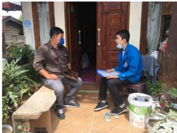
Gambar 2. Foto pada saat wawancara dengan Kepala Desa Lingga