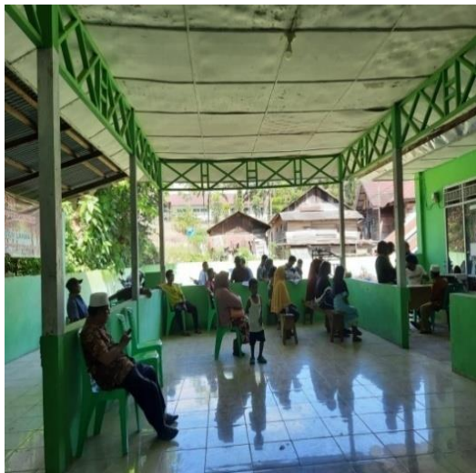
Dokumentasi Anggota Plasma mengambil sisa hasipenjualan.