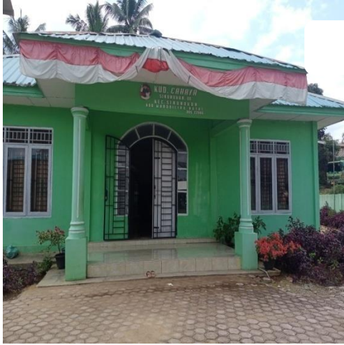
Kantor KUD Cahaya