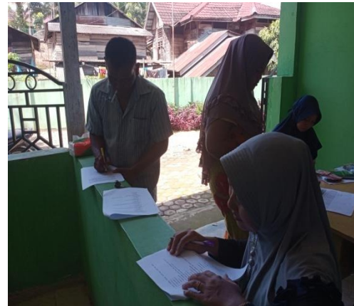
Dokumentasi saat sampel mengisi kuisisioner