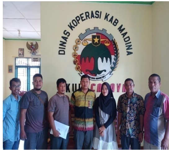
Dokumentasi dengan pengurus KUD Cahaya