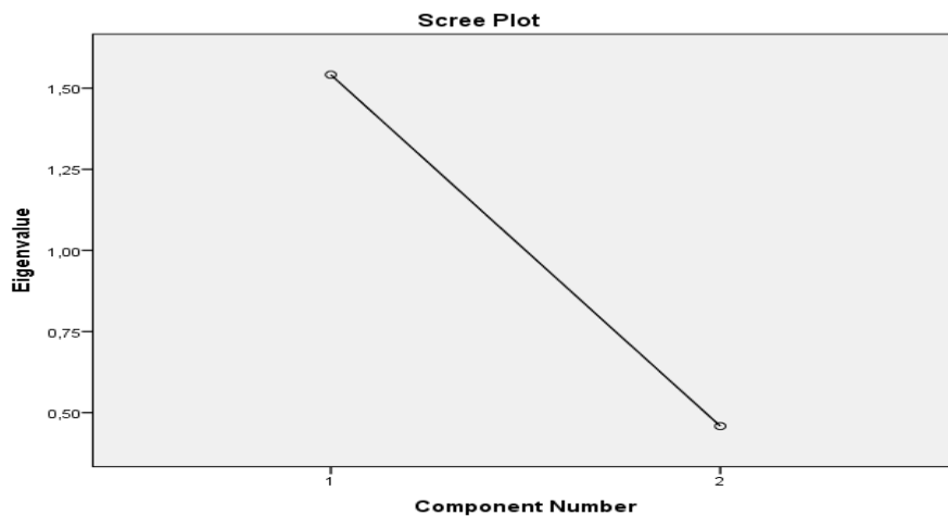
Gambar 4.3 Nilai Signifikan Masing – masing Variabel

Berdasarkan tabel diatas kita dapat ketahui nilai variance explained-nya yang terdiri dari dua nilai yang memiliki nilai efektif dalam meningkatkan hasil belajar akuntansi siswa. Nilai Intial Eigenvalues dari komponen minat sebesar 1,542 dengan variance 77,078. Komponen pemberian bakat pada pembelajaran sebesar 0,458 dengan variance 22,922. Kedua nilai Extraction Sum Of Squared Loadings yang bagus untuk menentukan nilai variansnya yaitu nilainya ada pada komponen variabel minat sebesar 1,542.