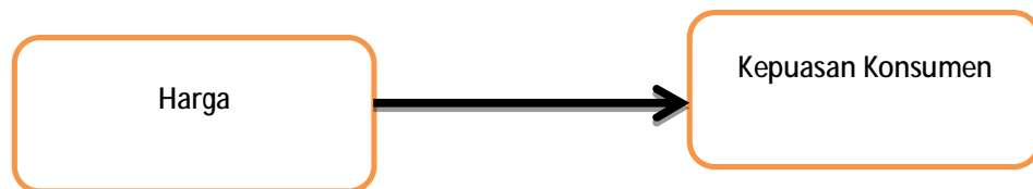
Gambar II. 1.

Adapun kerangka berfikir yang dimaksud adalah: